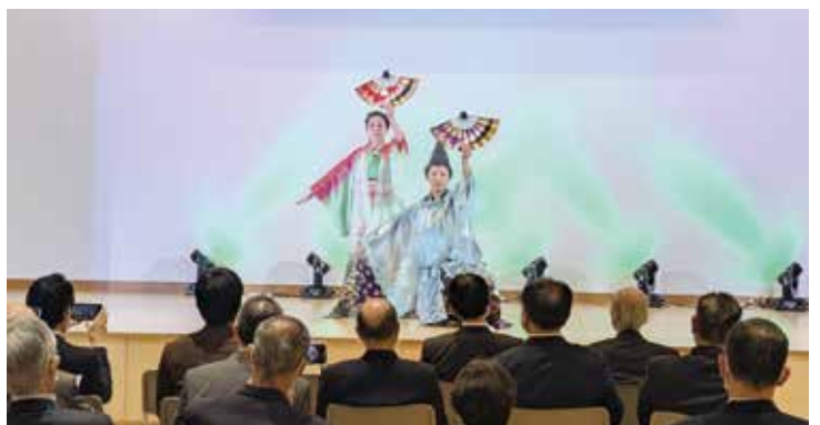
高山村合同舞踊会による演舞

村制施行70周年の年に公民館がリニューアルしたことはとても意義のあることです。今まで以上に村民の「つながりと学び」を確保し、地域課題の解決、社会の動向や村民のニーズに柔軟に対応できる公民館としての機能を十分に果たすべく、多くの方に利用してほしいと思います。