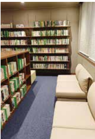
青いカーペットのおこもり空間