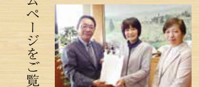
浦井会長から答申されました

すべての村民が生涯を通じて健康で心豊かに暮らすことができる村の実現を目指し、今後の健康づくり施策の方向性を示すものです。