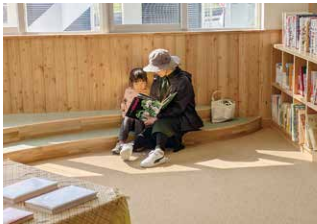
小あがりスペースに腰掛け、絵本を読む利用者