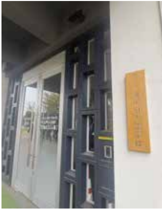
全国初の公立日本語学校

分譲地「グリーンビレッジ」は美しい街並みを実現するため、細かい規定を設けており、実際に美しい街並みであった。 複合交流施設「せんとびゅあ」の2階には全国の公立日本語学校があり、約300名の生徒が海外から学びに来ている様子も見ることができた。 全国的にも有名な東川小学校は、スケールの大きい平屋建てで、廊下は270mもあり、オープン教室の学びの場として、400名を超す子どもが学んでいる。壁がない解放感あふれた教育環境で、小学校を見て移住を決めた方も数多くいらつしやるとの事。学校敷地も4ヘクタールと北海道ならではの広々とした開放的な環境だった。