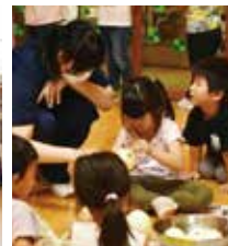
同じく職場体験を行っていた、たかやま保育園や、定住支援室での様子を写真撮影させてもらった

今回、私達議会でも初めての機会でした。何をしようか、どうしたら中学生から意見を出してもらえるかなど、手探りの中、お話をさせてもらったり、中学生が思っていることを聞かせてもらったり、大変有意義な時間でした。