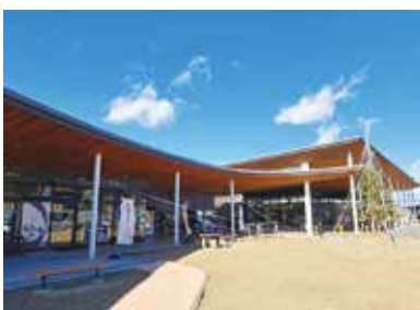
3年前に視察・研修した「道の駅南信州とよおかマルシェ」

立地や施設、機能などのほか、財源確保が重要な課題。村民のご意見をお聞きし高山村らしい施設整備が出来るよう検討して参りたい。