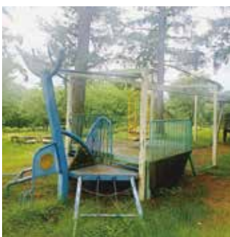
現在のYOU遊ランドの遊具

アスレチック広場は開園から30年余りが経過しており、遊具の更新のみならず、広場全体の整備も一体的に考えていく必要があるのではないかと考えている。今後、運営研究委員会など関係の皆様や村民の皆様からのご意見等を聞きながら、魅力ある広場になるよう検討していきたい。