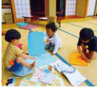
5/18 荒井原ふれあいセンターの様子