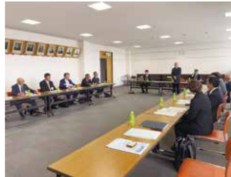
沼田町庁舎にて施策の説明を受ける

『住みたい田舎ランキング シニア世代・子育て世代・若者世代・単身者各部門1位(北海道エリア)』の沼田町は、面積283.35km 2 人口2739人 世帯数1423世帯(本年4月末現在) 6年度の転入者は115人。 冬には2m近く積もる豪雪地帯、冬だけ降り積もっても、万全の除雪体制との職員の説明が印象的だった。 農村型コンパクトエコタウン構想により、駅周辺を中心に半径500m圏内に学校、診療所、高齢者施設、スーパー等を集約、高齢者でも歩いて暮らせるまちづくりを進めている。 「ワンストップサービス」を目指し、移住定住支援室を設置。子育て支援の申請や結婚資金支援、住宅購入補助金