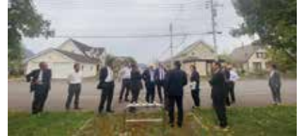
グリーンビレッジの様子

分譲地「グリーンビレッジ」は美しい街並みを実現するため、細かい規定を設けており、実際に美しい街並みであった。 複合交流施設「せんとびゅあ」の2階には全国の公立日本語学校があり、約300名の生徒が海外から学びに来ている様子も見ることができた。 全国的にも有名な東川小学校は、スケールの大きい平屋建てで、廊下は270mもあり、オープン教室の学びの場として、400名を超す子どもが学んでいる。壁がない解放感あふれた教育環境で、小学校を見て移住を決めた方も数多くいらつしやるとの事。学校敷地も4ヘクタールと北海道ならではの広々とした開放的な環境だった。