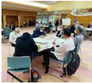
5/18 高山村保健福祉総合センターの様子