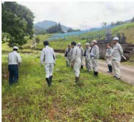
蕨温泉ふれあいの湯から50mほど南の農道沿い

蕨温泉の新たな源泉掘削予定地は、すぐ近くの道路沿いで、掘削工事や維持管理が容易な場所と言えます。