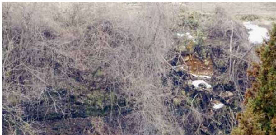
対岸から撮影した崩落現場と断層

把握し、保全対象を特定し範囲の土地を収用することが公共の利益の観点から合理的であると考える。 土地所有者にお伝えし、引き続き県や関係機関と調整し崩落対策について協議したいと考える。