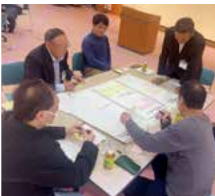
5/11 高山村保健福祉総合センターの様子