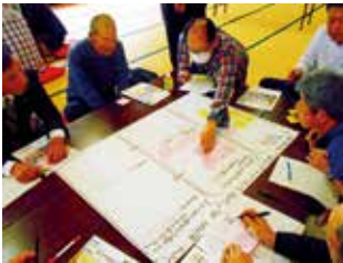
5/11 堀之内研修センターの様子