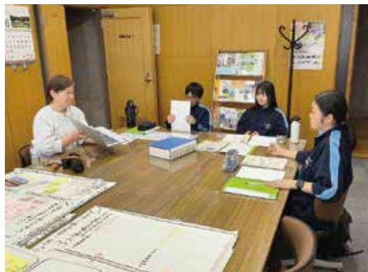
活発な意見交換ができた

この日は、議会一般質問の通告書のメ休日だったため、その受付業務を手伝ってもらったり、同じく職場体験が行われている村の施設へ行って写真撮影をさせてもらいました。また、議会のことを中学生にも分かってもらいたいと作成中の「議会のしおり」を見てもらい、より読みやすいものにするためのアドバイスをもらったりしました。