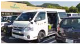
買い物支援バスの試験運行

①登録は10名、高井3名・中山6名・牧1名で、70代5名・80代3名・90代2名であった。 ②「ありがたい」「以前から望んでいた」「もう少し対象を広げては」の声を頂いた。 ③頂いた意見に加え、秋以降の稼働を、協議会において検討を進めていく。