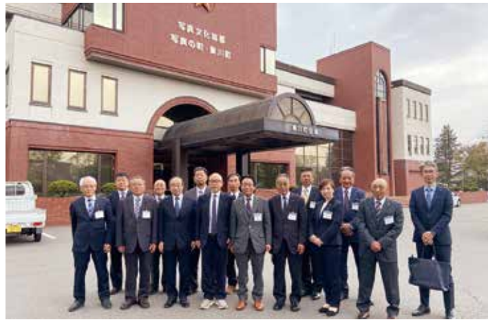
東川町役場前にて

東川町は北海道のほぼ中央に位置し、北海道第2の都市である旭川市に隣接している。町の東部は日本最大の自然公園「大雪山国立公園」に属しており、鉄道、国道、上水道の三つの道がないという特殊な環境の自治体である。そんな東川町は、30年間で人口がゆるやかに伸び、平成7年頃には70000人台だった人口が、現在は86000人と約2割程人口が増えてきた。