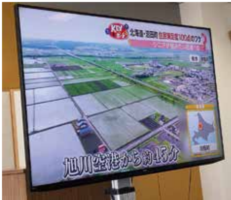
朝の情報番組で放映された

『住みたい田舎ランキング シニア世代・子育て世代・若者世代・単身者各部門1位(北海道エリア)』の沼田町は、面積283.35km 2 人口2739人 世帯数1423世帯(本年4月末現在) 6年度の転入者は115人。 冬には2m近く積もる豪雪地帯、冬だけ降り積もっても、万全の除雪体制との職員の説明が印象的だった。 農村型コンパクトエコタウン構想により、駅周辺を中心に半径500m圏内に学校、診療所、高齢者施設、スーパー等を集約、高齢者でも歩いて暮らせるまちづくりを進めている。 「ワンストップサービス」を目指し、移住定住支援室を設置。子育て支援の申請や結婚資金支援、住宅購入補助金