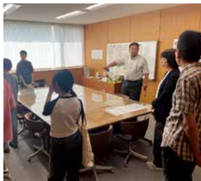
議場、全員協議会室、委員会室など、議会で使っている3階の部屋を見学してもらった

6月29日(日)、新しくモニターになられた皆さんにお集まりいただき、第1回目の議会モニター会議を開催しました。