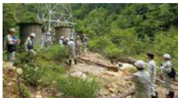
奥山田源泉 どの設備も劣化が著しい

年を超える歴史の中で発展してきた山田温泉郷の貴重な源泉資源を、将来に渡って守り続けることが重要と認識しました。