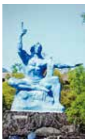
長崎市 平和祈念像

憲法前文には「政府の行為によって再び戦争の惨禍が起ることのないよう」にする」としている。憲法改正は国会において議論を深めることが大切と思う。私は、どうすれば平和を守り続けることができるか、国民の一人として考えていきたい。