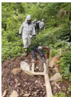
谷下まで徒歩20分 作業道が未整備で危険を伴う

二つの源泉は松川沿いにあり、土砂崩れや雪崩等が多く、引湯配管の維持管理は困難を極めます。修繕作業には大きな費用と安全の確保が課題で、早急に抜本的な改善策が必要です。