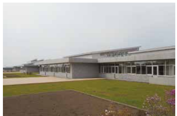
東川小学校外観 町の中央部にある平屋建ての広々とした小学校 この他に3つの小規模の小学校がある