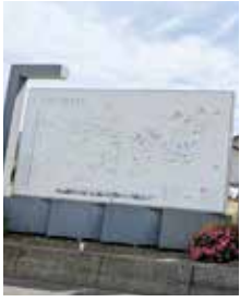
本村入口にある看板だが、色が褪せてきている現状

須坂市より、長野市を含めた4市町村での広域的な情報発信ができないかとの打診があり、本村としては願ってもない提案なので、積極的に取り組んでいく。