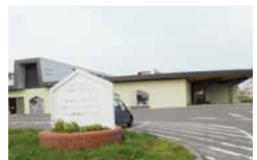
「暮らしの安心センター」 充実の医療施設が併設されている

ニック」も併設され、内科、外科、皮膚科、人間ドックも受診可能で、住民が安心できる充実した施設と感じた。