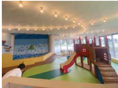
暮らしの共生エリア そらいろ内観 小さな子ども達も安心して遊べる屋内施設 この他にキッチンやトレーニングルームもある

「暮らしの共生エリア そらいろ」、温泉複合施設「きとろん」、また全国的にも珍しい公設民営化企業誘致「三千櫻酒造」等も見学し、午後3時まで視察研修を行った。 東川町は、個人的に3年程前NHKで放送された『「映える町」移住者が多い東川町』を見て、いつか機会があったら視察したいと思っていた。そんな折、昨年7月の須高3市