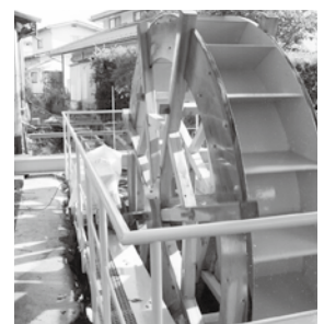
県の補助金を利用して有志で発電事業に取り組んでいます