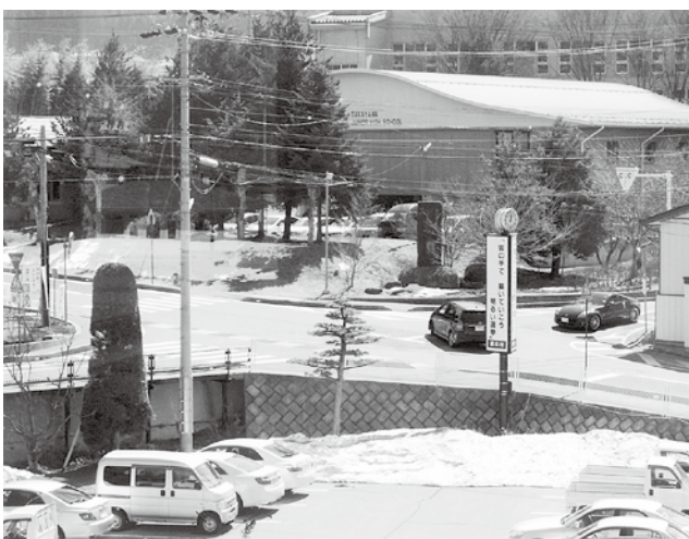
事故多発する役場前の交差点

答弁 高山診療所は院内処方のため、ストックする薬の種類も限られるため、ジェネリック医薬品の利用はむりです。