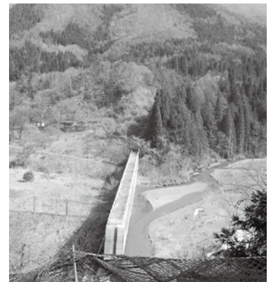
村が出資にすすめている水力発電所がこのダムの下に造られます〔山田温泉下の高井砂防ダム〕

委員会の意見を聞いていきたい。 ②、建設に必要な多額の費用の調達や、維持管理に要する費用などを充分検討し支援をしていきたい。