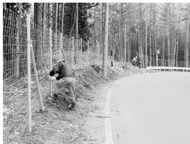
村の収入の内44.6%が地方交付税です (24年度事業の電気柵を作っています)