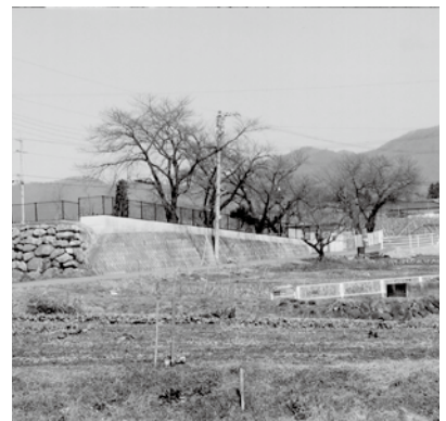
子育て世帯や若者世帯に便利な保育園近くに集合住宅を作り、人口増加に努めては