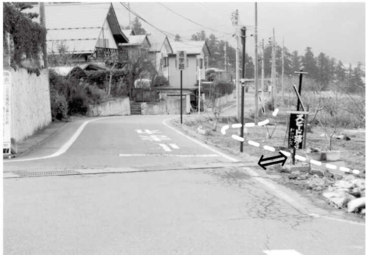
大宮北団地西側の通学道路。 新しい道路は右側の線のとおり、2m広くなります。