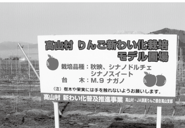
低樹高で作業効率が良く、高齢化対応の新わい化栽培

その中で、村内外から農業をしてみたい方や、農産物を守るために支援される人を集め会員になって、高山村のブ