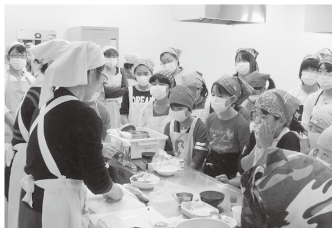
偏食になりがちな子供たちに、バランスよい食事を！ 親子でふれあいクッキング教室