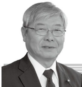
篠原 尚元 議員