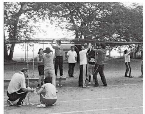
小学校の運動会で、子供達の席に寒冷紗を張る先生。先生は、こんなことまでしなければならぬ。

平成24年度長野県教育委員会基本方針に記述されている、「教員の資質の向上と教育体制の整備」を、村における教員の職場環境に焦点を絞って考えては