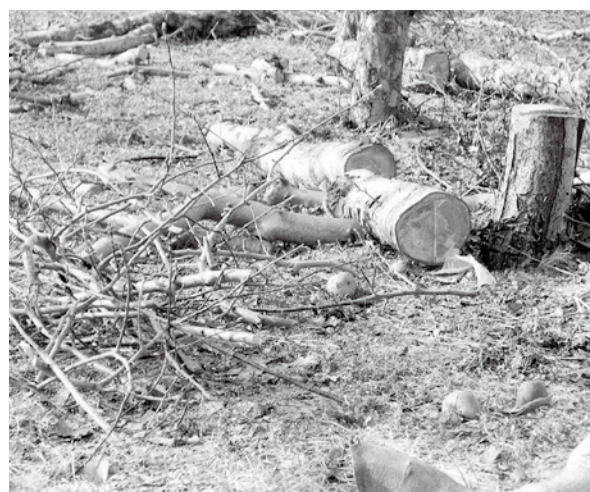
園地が廃園になる前に次の担い手へ、円滑に引き継ぎ、産地維持を