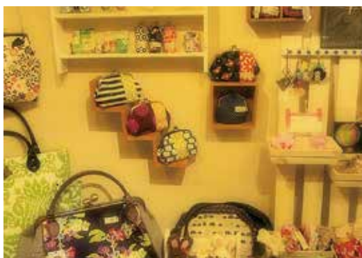
ハンドメイド作品をのぞいて見て下さい

お茶しながらガールズトークしてくれる中学生、お子様連れで安心してきて下さるママさん、リンゴや野菜をお土