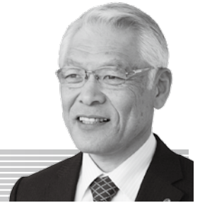
山 寄 秀 治 議員