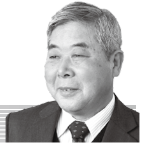
堀江 繁太郎 議員