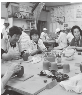
無心で童心に帰った陶芸教室 自分で作った器で飲むのも 楽しみのひとつ