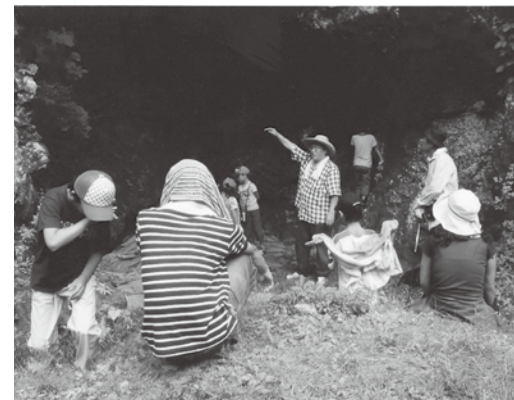
血が繋がっているといわれる、 古代の住居跡（湯倉洞窟）の親子学習会