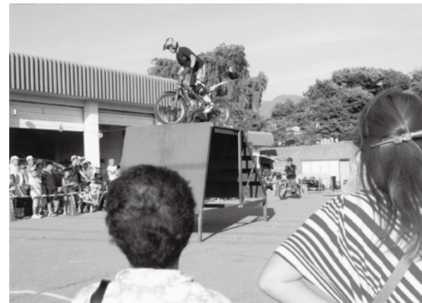
消防バイク導入は訓練が必要 高山祭りでバイクの実演

①、村の消防団196人の団員数の中で、バイク隊を編成することは難しく、編成しても訓練日数の確保など団員の負担が増すこ