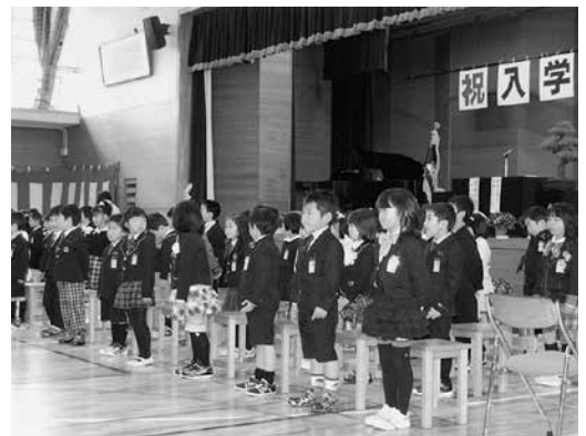
このりりしき姿 よそ見しちゃダメだよ、ちゃんと前を見てネ!!