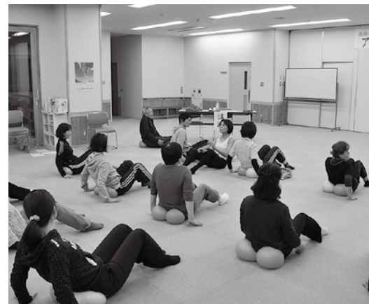
ちょっとした「づく」で健康づくり いちにつきさん (ボールエクササイズ)