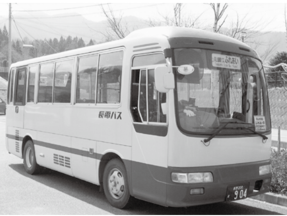
須坂市・千曲市・飯山市・飯綱町などで乗合バス、乗合タクシーを運行しています

今後、空き家の活用は、早めに所有者の意向を聞き田舎暮らしを希望する人たちの意向に沿った仕組みが必要です。