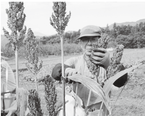
ソルガムの実は食用に。茎は飼料に、根は肥料に捨てる所のない穀物です

これから農道や水路を整備し、大規模な耕作を計画しているワインぶどうなど、農産物の選定と併せ、圃場の区割りなど、協議しています。