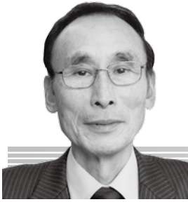
内山 信行 議員