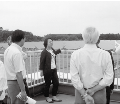
上越市の工場跡地で太陽光発電施設を視察し、経営的に成り立つのか説明を受けた

村長 村では水力発電を進めています。これまでと変わらず家庭への補助は続けていきたい。