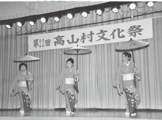
このように3人で踊れば、舞台がいっぱいになってしまう。ゆったりと舞台上で踊りたい

質問 ①、高山小中学校の現状と問題があれば、今後の対応は。 ②、安心して働く環境とは、どのような環境なのか、心と体の健康管理の対策を取られていたのか。