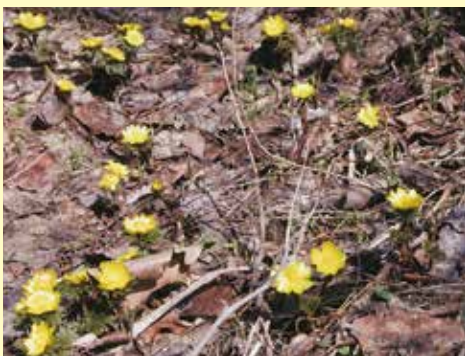
春一番に咲く庭のすみに咲く福寿草は心を和ませてくれる