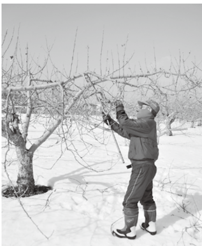
冬の作業が収穫を左右します。自然と手に力がいります