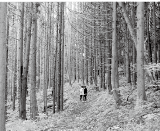
舗装の上を、歩くだけが散歩じゃないよ ここを、ゆっくり歩くのが長生きの秘訣