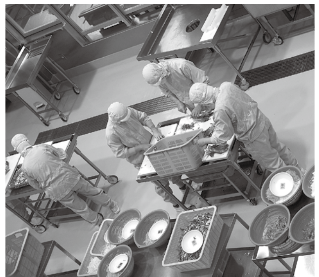
広い調理場で、十分な手作業で給食を作っていました

高山村給食センターは、子どもたち667人と職員分の給食を作っています。 子どもたちだけでみると、飯綱町は高山村の1.2倍の人数の給食を高山村の2.8倍の広さの共同調理場で作っていることとなります。