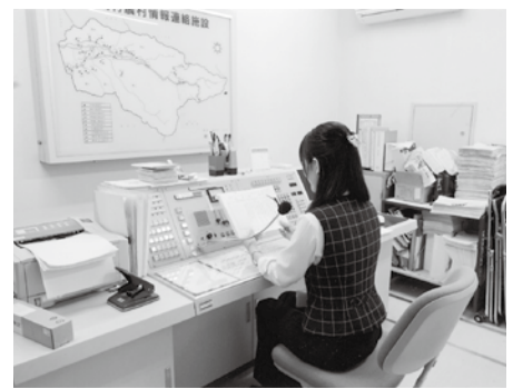
ここから村内へお知らせが送信されます