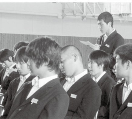
中学校の「人権教育強調月間」集会 生徒の活発な意見が続く

③、高齢者虐待、障害者虐待の相談窓口を設置して、相談の受付、事実確認及び支援を行っています。