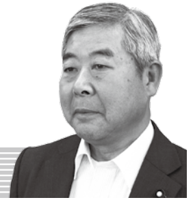
堀江 繁太郎 議員