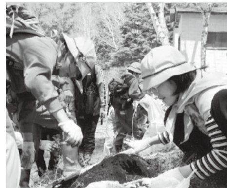
「大きく元気に育ってね」とみんなで声をかけながら植えました