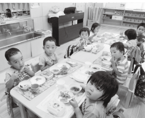
「今日のおかずはなにかな」 おいしい、おいしい給食です