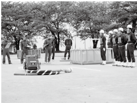
今年は頑張って全国大会を目標に

①、火災警報器の耐用年数が10年程度なので、更新時期を迎える方や新設される情報を提供していきたい。 ②、避難生活中で女性の参画を推進するとともに、女性専用のもの干場、更衣室、授乳室の設置など、女性や子育て