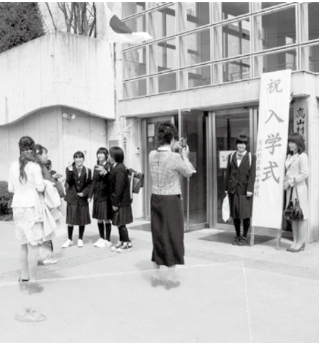
教育にお金がかかります 義務教育無償化は国の責任で

委員会・本会議とも全員賛成で採択し、同趣旨の意見書を政府及び関係行政官庁に送りました。