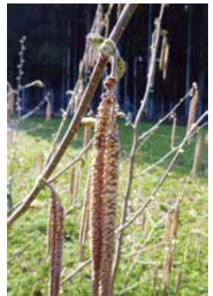
ヘーゼルナッツは北米・地中海地方で栽培され、味はクルミに似ています。

ヘーゼルナッツを栽培しています。 ヘーゼルナッツは退職後に姪（弟の次女）の働いているアメリカに弟と行った1週間の旅行で、種子を手に入れ3年前より収穫できるようになりました。 この畑は久保と水中の間にある上野の奥（大窪地籍）で、以前は猿の被害により荒廃農地となっていた場所を復元しました。 また地域では老人会に入会しました。久保老盛会も昭和36年の発足から52年を迎え、