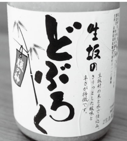
農業公社が販売しているどぶろく