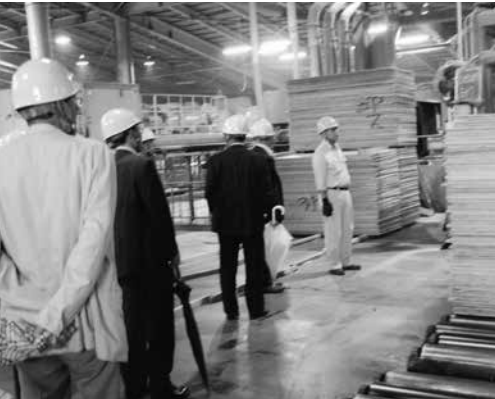
高山村にも杉やカラ松はたくさんあります。もっと有効に活用しましょう