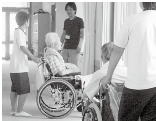
「中学生の職場体験」自宅介護が望ましい