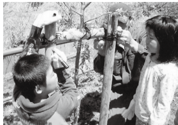
「暑い中頑張ったから記念に名前を入れちゃうよ！」 植樹祭にて

①、小学校では、天井に設置された換気扇2台を使い暑さ対策をおこない、5月27日より水筒を持参し、授業中はもちろん登下校も水分補給しています。 ②、小学校では、2カ月に1度、自分自身を振り返る、「ひとり立ち、とも育ちノー