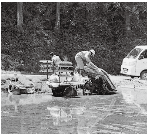
5月29日の水利制限前にJAと連携しながら、営農支援センターによる田植えが行なわれた

①、今回の総会で、加盟町村が災害に見舞われた場合に、相互に支援する「災害時相互支援宣言」が採択されたことは会員の絆が深まり、誇りにおもっています。