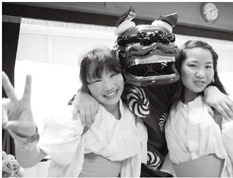
子育て支援には地域のコミュニティーも大切な役割をはたしています 「一生懸命舞いました！」