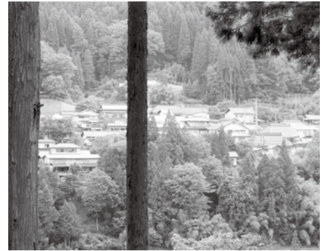
これぞ、ふるさと原風景 この景観を後世にのこすのが、 生きている人の役目