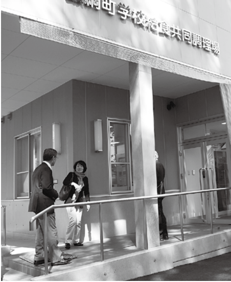
飯綱町の学校給食共同調理場の玄関 食材の搬入口と給食配送口は別にあります

特別委員会で、高山村の学校給食センターの改築議論が endpoint でした。 改築を議論するのであれば、近代化された飯綱町の学校給食共同調理場視察研修が最適となった訳です。 共同調理場はどこにあるの？