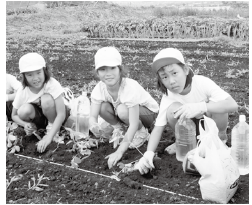
都会の人達が土とふれあい農業の良さを体験できる空き家が必要です

道おしえの会や古道復活の会の皆さんと連携し、観光協会とともに魅力ある高山村を広く紹介しています。