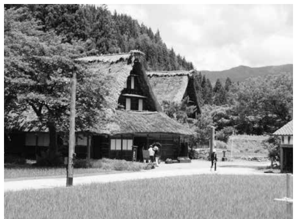
大雪で陸の孤島になる中で、生活の苦勞が目にかびます。

白川郷とともに世界遺産に登録された五箇山菅沼集落には、現在9戸の合掌造り家屋が残されています。