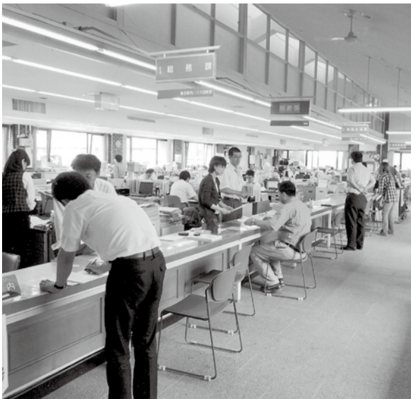
皆さんのお役にたっています…役場窓口

交付税が削減されたもとで、住民サービスを低下させないためにやむを得ないものです。