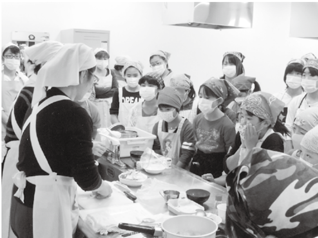
地域の人と楽しく給食を作るスペースが欲しい

や設備の老朽化が進んでいます。衛生管理上課題が多い改善を要する施設だと思います。