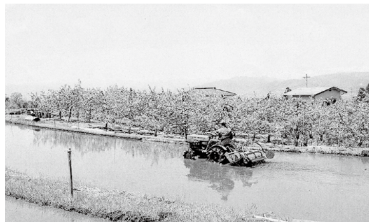
5月の記録的な少雨により、水田の代掻きは6月になりようやく本格的に始まりました