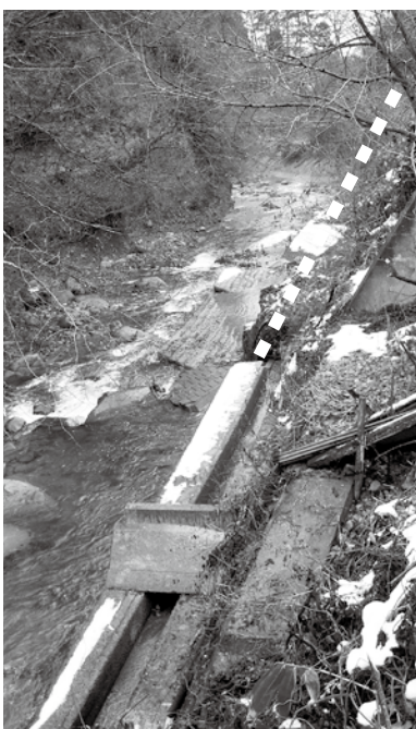
台風18号の大水災害により明治沖水路取り入れ口付近(白線部分)が崩落し災害復旧費に計上されました。

改選後初めての一二月定例会は、一二月六日開会一三日までの八日間の日程で開催しました。条例改正一〇件、一般会計及び特別会計補正予算三件を原案通り可決。請願一件は不採択、陳情二件は採択、議員発議の意見書二件を可決しました。 一般質問は六議員がおこない、村政の課題などをたどしました。