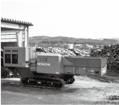
土場（貯木場）の自走式チョッパー。150cm くらいの長さの丸太を後部に入ると前部から粉々にされて吐き出されます。(下川町)