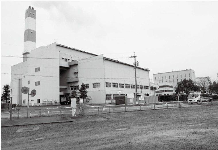
現在稼働中の長野市の焼却場です。新施設の日量 450 トン焼却炉もこの地区に予定されています