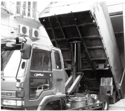
下川町五味温泉（町の公社で経営）の木質ボイラーのホッパーにチップを投入するダンプカー。この車で各所のボイラーに木質燃料を配っています。

地域集中熱暖房を施した新しい団地。暖房も風呂も配管された温水で賄う。手間いらずで若い人に人気の団地という。只今、隣に別の団地を増設中です。(下川町)