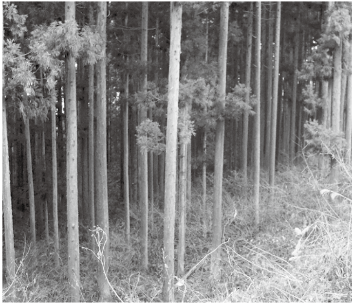
間伐の実施されていない杉林は、対岸の景色も見えず、杉がよろよると林立している。太陽の光がほしいようだ。

質問 熊の侵入経路など獣害対策の総括と来年度に向けては、どのような対策を講じられるのか。