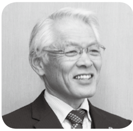
山崎 秀治 議員