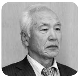
涌井 仙一郎 議員