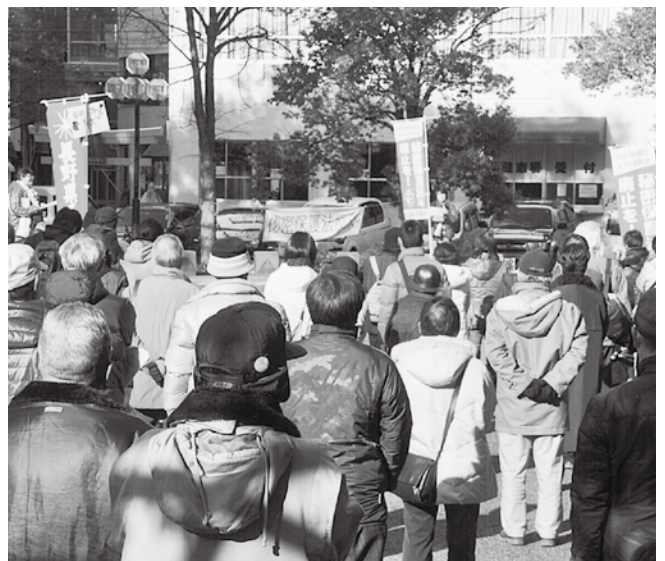
「秘密保護法」が国会で可決後も全国で「廃止」を求めて集会・デモが行われています。長野市でも 12 月 28 日、160 人が参加し集会・デモが行われました。

秘密を指定、関係する公務員や民間人のプライバシーを丸裸にし、秘密を知ろうとする国民を広く重罰で処罰する、主権在民、基本的人権、平和主義という憲法の基本的原則をことごとく覆す違憲立法ではありませんか。