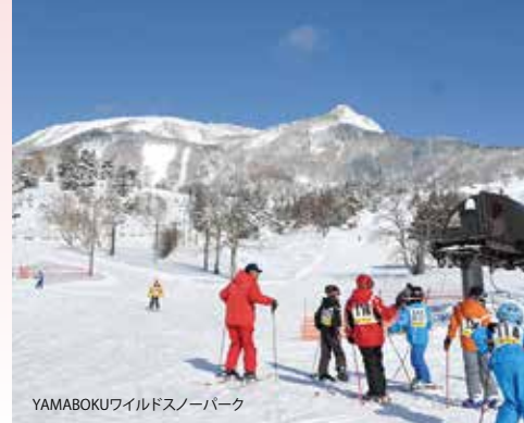
YAMABOKUワイルドスノーパーク