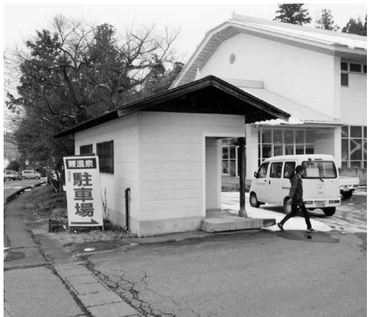
この建物が公衆トイレと分かりますか？道路から見える表示がほしいですね。