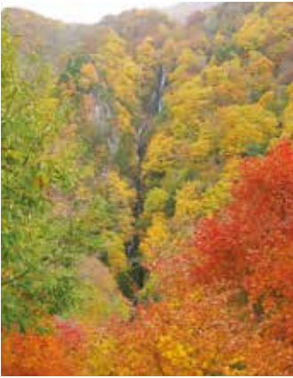
美しい紅葉に囲まれた八滝 2013年10月29日

紅葉の問い合わせは春か ら始まります。秋に近づく につれ件数は増し、一〇月 に入ると現状を聞く問い合 わせの電話が鳴り続きま す。パンフレット 郵送の依頼からア クセス方法、旅館 案内、見所、イベ ント情報、周辺の 観光地について