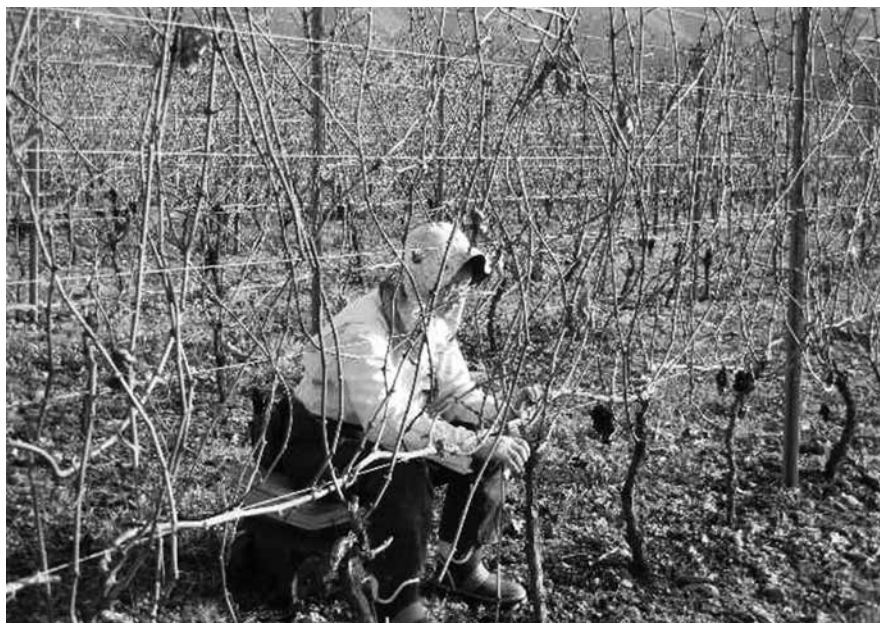
暖かな日差しの中、ブランド化を目指す高山ワインぶどうの剪定作業。農業と観光の連携を図りながらTPPからも守っていかなければならない。

質問 TPP交渉が続く中で農産物五項目の関税が撤廃され、コメの減反に支給額を減額させる方向で調整されている。本