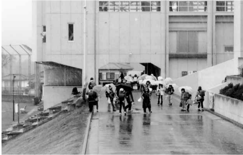
雨の中の下校風景。