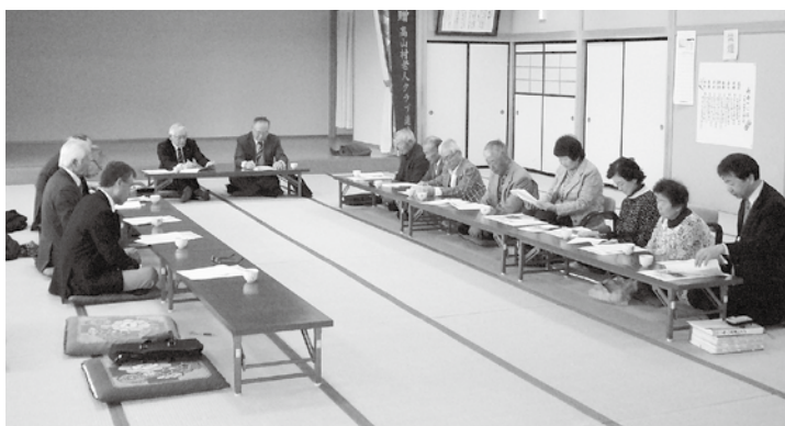
チャオで開かれた高山村老連との懇談会。

地区で活動しても「村老連」に加盟されないのはなぜか、他の地域の現状はどうか、「村老連」の果たす役割、今求められている活動は何か等について意見交換を行いました。