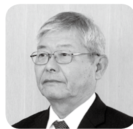
篠原 尚元 議員