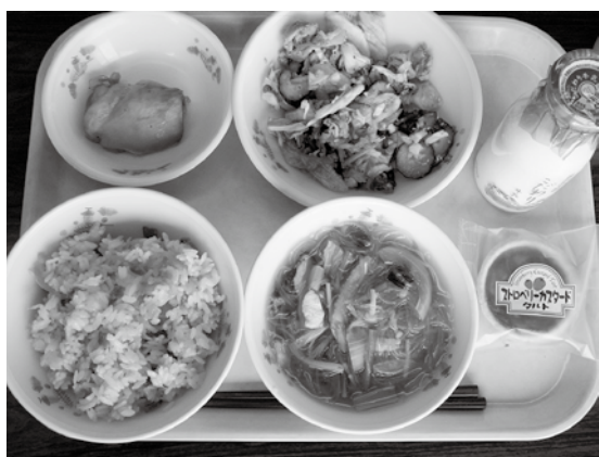
試食会のメニュー。キムタクごはん(キムチ+タクアン)、信州高山こだわり牛乳、ささみと春雨のスープ、鶏のレモンソースかけ、焼肉サラダ、ストロベリーカスタードタルト。

野菜・果物・きのこ・小麦粉・みそ・ソルガム・ハーブ(ルッコラ)・米(風さやか)等、本村産の物をたくさん使い、地産地消を大切に考え「食べてみようかな」と思う気持ち、その気にさせる「新しい食」との出会い食歴