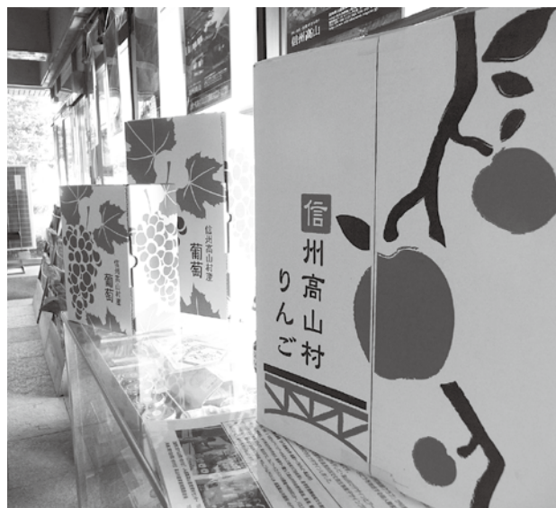
返礼品にこうした村の特産物を差し上げてはいかがですか。村外へ出ておられる方々もきっと喜ばれると思います。パッケージは女子美術大学生の作品（村民ホール）

寄付金の使途については、農業振興は本村にとっても最も重要なものと考えており、本来の趣旨に沿って、引き続きJA須高・商工会等、関係の皆様のご意見をお聞きしながら、魅力ある村づくりに努めます。