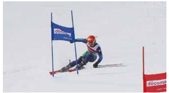
ワールドカップ苗場大会（2月13日）