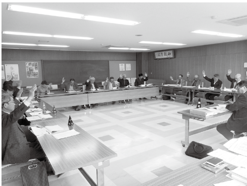
農業委員会の使命は、農地制度の適正な運用と「農地を守り、農地の有効利用を促進する」ことです。

質問 農業委員会組織、制度は六十数年ぶりに「改正農業委員会法」が4月1日より施行となり、選出方法の見直しや、農 土地利用最適化推進委員の新設などが主な改正の柱です。今までの許認可中心から、農地集積、集約化、耕作放棄地の発生防止、解消、新規参入の促