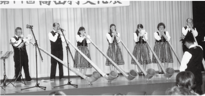
現公民館は昭和54年の建設、3階講堂は舞台の問題、音響や照明設備などで多目的ホールとして機能が十分でないとの声もある中、新文化施設の検討が行われてきています。建設の是非をめぐり一層の論議が求められます。