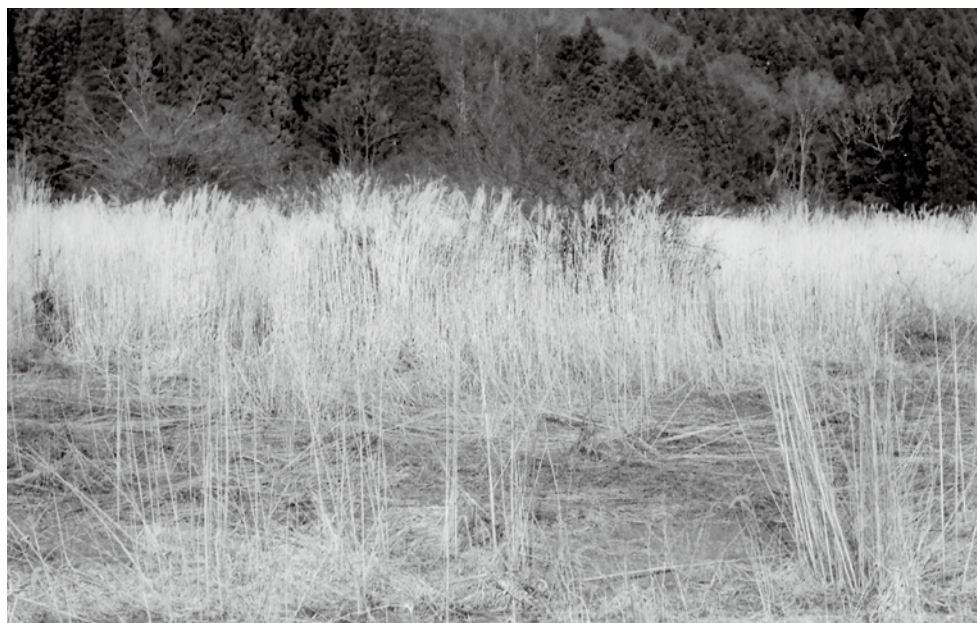
遊休農地の発生防止、解消の推進については、農地パトロールの実施、対面調査で所有者の実状把握。