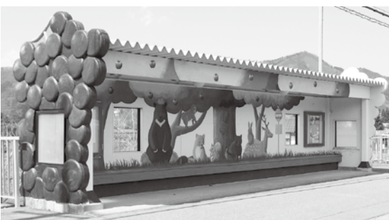
役場前の新バス停と小学校前の「バスストップギャラリー」。小学校前は規模も大きく、村のバス停のメインシンボル。役場前は都会的なデザインであるが、寒風対策・日差し対策を懸念する。