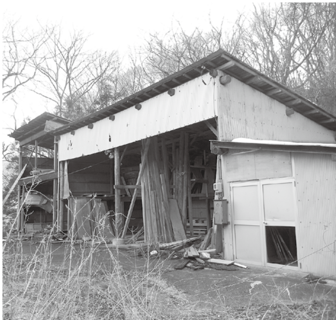
放置された資材置き場。

て、対策や措置を講ずる事が可能と考えますので、条例の必要性はないと考えています。