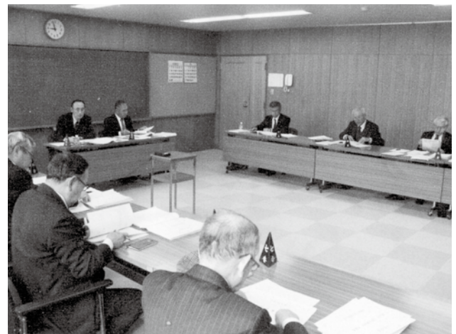
予算審査特別委員会で慎重・活発に審査。

答 小規模宅老所は18人未満の施設である。地域密着型に移行する通所介護事業所は、実態を把握しながら必要性の有無を含め検討したい。