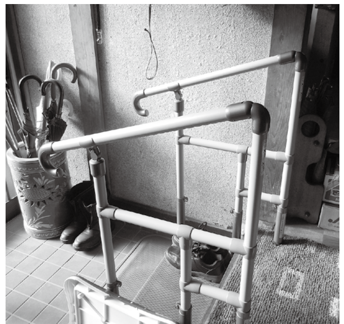
住宅改築で玄関入口に手すりを取り付けるにも補助が出来ます。

質問 障がい者は住み慣れた所で在宅生活したいと願っています。障がい者の居住環境の改善等の充実が求められている。