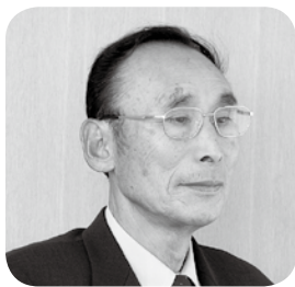
内山 信行 議員