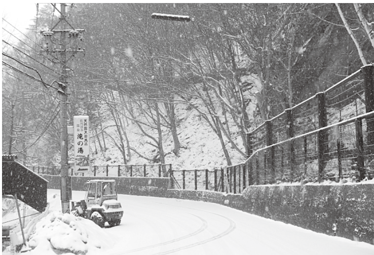
今年の1月29～30日長野県中部で雨氷による被害が発生したが、山田牧場線と山林への被害はなかった。