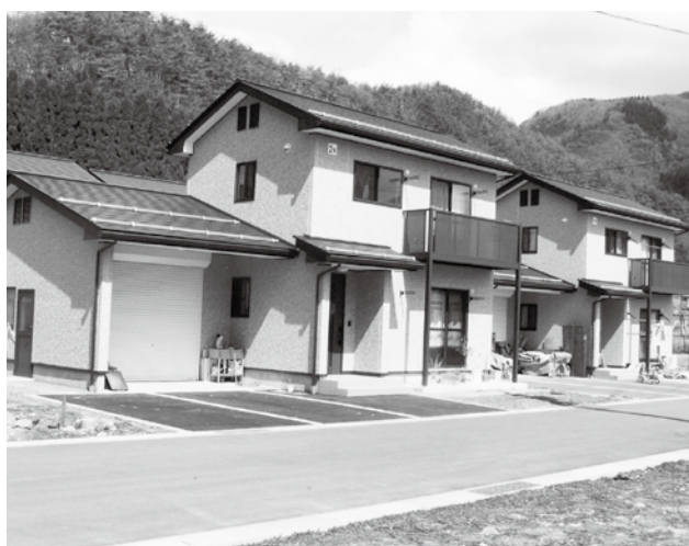
旧山田保育園跡地に建設された、新規就農者・認定農業者 用村営住宅2戸、高山村での永住を心より歓迎いたします。

③里親登録されている方 は現在8名います。農地・ 圃場については、山沿い の農地などが多く、耕作 放棄地になっている農地 を借りて農業を始めると いったケースが多いです。 【答弁】（小林建設水道課長） 「高山村空き家活用推進 事業」を新年度から制度 化し助成制度を設け、賃 貸していただける住宅の 確保を推進します。