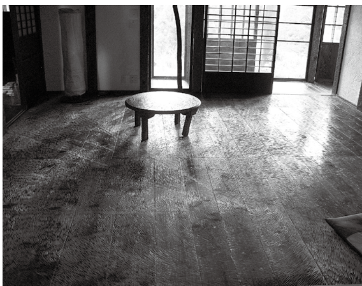
「大地の芸術祭」で建物自体をアート作品とした「脱皮する家」。築150年の古民家の壁・柱・床などを学生が彫刻刀で彫り作品化。人の労苦が刻み込まれており、圧倒的な迫力で来る人を包み込みます。