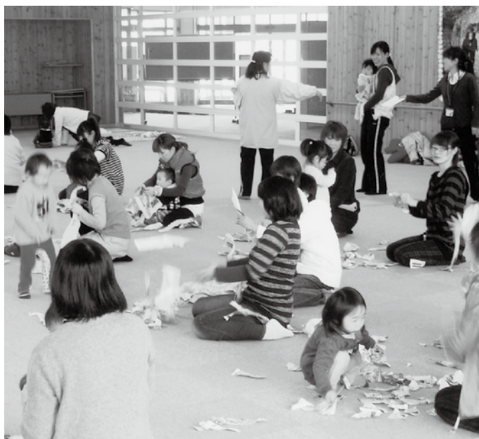
子育て支援センターで交流する親子、4月からは3歳以上児、第3子以降は保育料が無料になりましたよ。

この制度は、母子手帳 交付月の初日から出産月 の翌月末まで、出産に係 る費用とは別に、内科や 歯科、眼科といった保険 診療分を対象にすべての 医療費を無料とするもの で、県内の市町村では初 めての試みです。 おたずねの、妊産婦の 医療費の無料化につきま しては総合的な経済的負 担の軽減を図る施策の一 環として総合的に検討い たします。