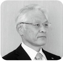
山崎 秀治 議員