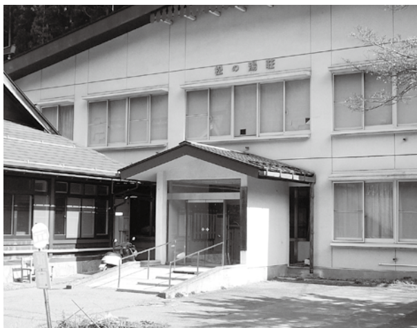
介護予防等に利用されている松の湯荘。もっともっと大勢の村民の皆さんに利用してほしいと思います。