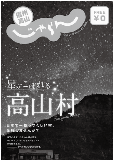
大手広告代理店も注目の高山村のきれいな夜空。 山田牧場の夜空はきらめく宝石のよう。

「道の駅」はかつて本村 でも検討されたようです が大変有効な施設になると 考えます。「星の駅」につ いては、本村の重要な観 光地の山田牧場の景観、 スキー、キャンプ、そし て最近注目されている星 空など観光資源を生かす ため星の駅の設置を考え ています。来年度、具体 化するための組織を立ち 上げ検討していきたいと 考えています。