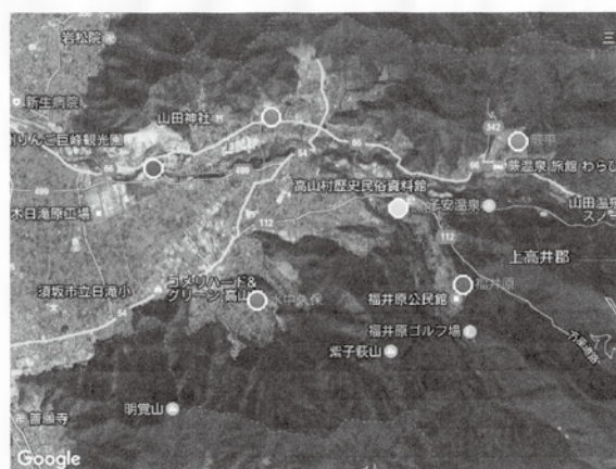
長野県高山村農業気象サービス

「高山村農業気象サービス」システムは6か所における気象観測データを伝送、表示されています。