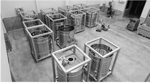
信州たかやまワイナリーへ醸造タンク貸与。