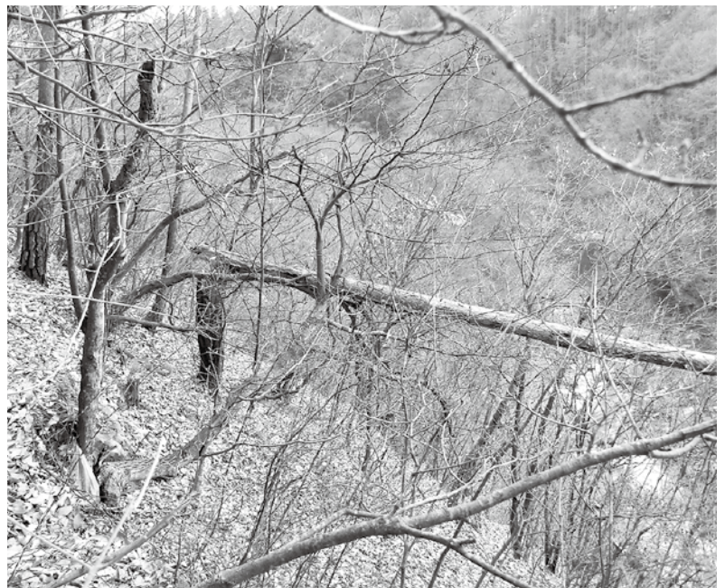
急傾斜地や崖の被害樹。倒木により電柵の破損も心配。