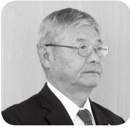
篠原 尚元 議員