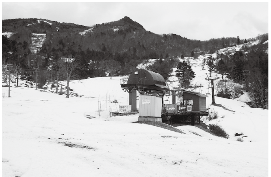
雪よふれふれ雪よふれ。 YAMABOKU ワイルドスノーパーク第1リフト乗り場。(2016年12月22日)

ふるさと納税に力を入れ、村の魅力を発信できるように取り組んでまいりたいと思っております。ここに力を入れることで、自主財源の確保と、新たな商品開発ができないかなど、総合的に検討します。