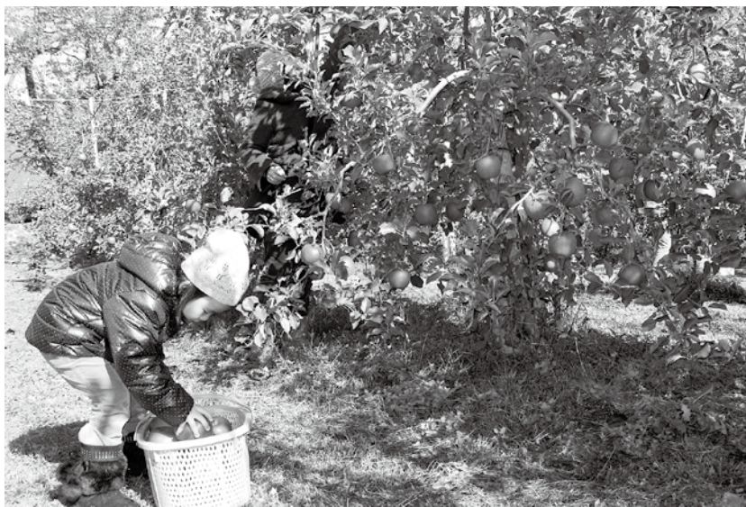
高山村には自慢のリンゴをはじめ、全国に誇れるフルーツが採れます。そしてワインや生ハムなどの加工品も増えてきました。同じ品でもキャッチコピーや説明文一つで魅力がイキイキとしてきます。コピーは高山村の自然や生産者の顔を伝える戦略的ツールです。

周知では「インターネットとパンフレットによる広報」が78%の団体、「ふるさと納税ポータルサイト利用」が43%の団体で