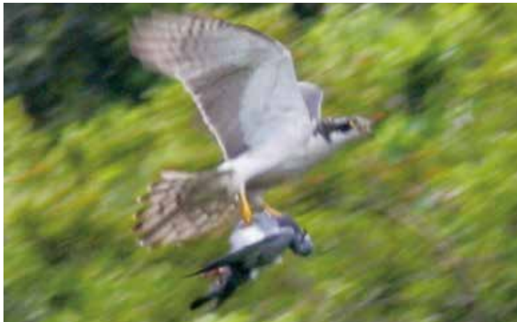
ハトを捕まえて飛ぶオオタカ。 畑作業中に、こんな場面に遭遇するのも高山村らしいところです。 2010年春。荒井原城山付近で本人撮影。

このような中で、私も高山村らしさを活かせる事に関われないかと考えていたところ、縁あってりんご作りを始めることができました。皆さんご存知のとおり、高山村のりんごは全国に誇れる産物だと思えます。これまで多くの方々がこだわって続けられてきたものが、よりよい形で少しでも多く今後になげられるようにできればと思っています。今後ともどうぞよろしくお願ひします。