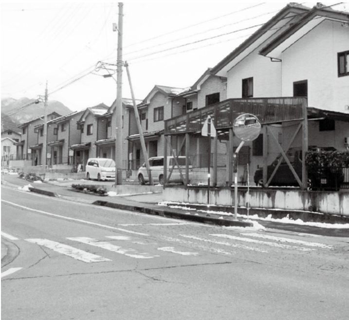
若者向け、移住者確保に向けての住宅地整備。原宮団地。