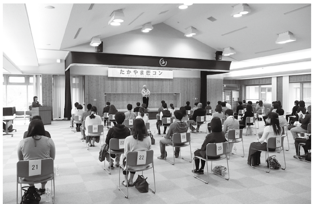
たかやま恋コン開催風景。

村社会福祉協議会、商工会の皆さんには継続して婚活イベントを行っていただきたいと考えてお