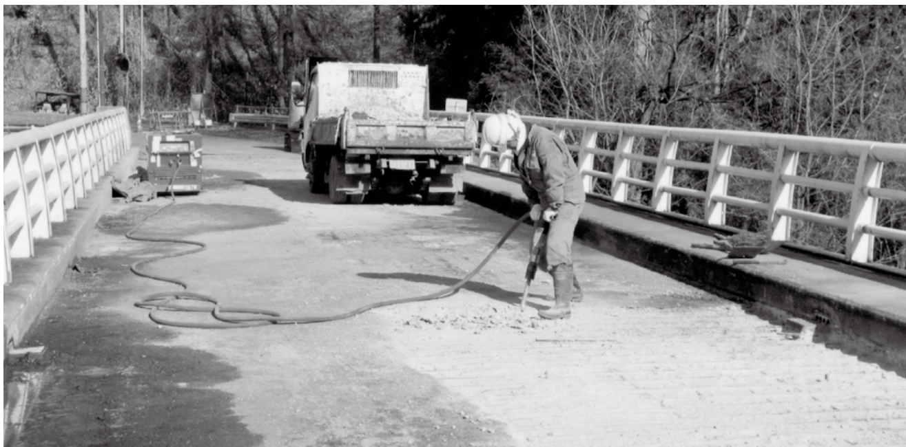
設計基準 14t でも施工されているが、大型車両の通行により、コンクリート劣化に伴う修繕工事中の駒場橋。

駒場橋は高井・山田地区を結ぶ重要な橋で、昭和46年に永久橋として架け替えされた。最近では通勤や高山保育園への送迎、高山共撰所やブドウ集荷場へ通ずる生活や産業道路として重要度が高まっています。当時の設計基準として14トン相当の2等橋として設計施工されており、しかし、建設から43年経過しており、大型車両の通行などによりコンクリートが劣化しており今回緊急に部分的な修繕をすることにいたしました。