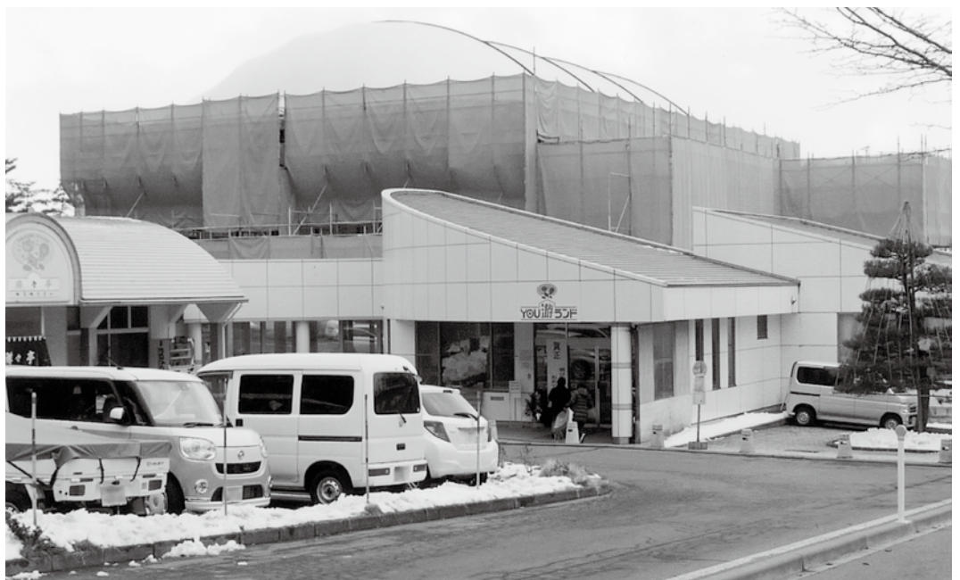
村民の健康増進が目的のYOU游ランド。

は低額の温泉のみを利用 する施設であり、健康増 進を目的とした「YOU 游ランド」を同一の指定 管理者に委ねることが最 適なのか否か。又、「YO U游ランド」のプール施 設に新たな劣化症状が発 覚したことにより、詳細 な調査をはじめ、工事期 間や費用など、現行計画