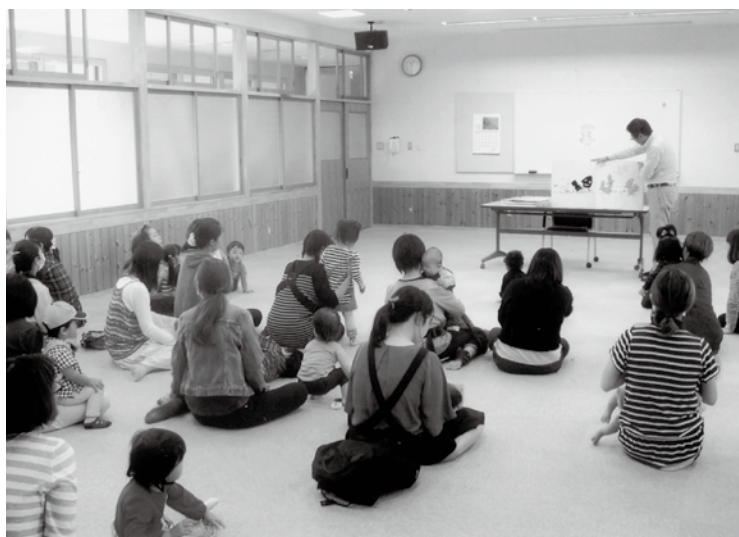
大事な村の宝物。めざせ人口8000人（子育て支援センター）

間営業を行った亀原商店が閉店し、藤沢商店の移動販売の中止、「よつていかね会」の休業と相次ぎ、さらに村の高齢化も5年前23・8%から現在26・3%と急激に進んでいま