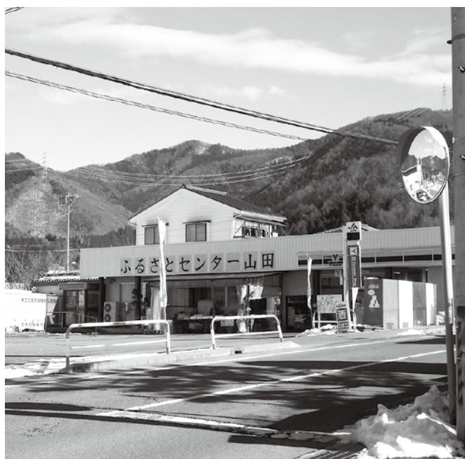
地域のためにがんばっている「ふるさとセンター山田」

都会からの「サテライトオフィス」などの企業誘致、若者の定住のための奨学金制度の見直しなど、検討していきますので村民のご理解をお願い申し上げます。