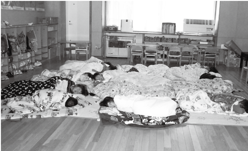
保育料軽減対策は…。お昼寝中のたかやま保育園3歳児「りんご組」さん。

建設により購入していた、米飯をセンターで炊き上げることににより、減額しました。段階的減額を考えております。②出生率を上げていくことは重要であり、多様化する保育ニーズに対応するとともに、保育料などを軽減する必要があると思っております。③医療の窓口無料化は、今後、県と市町村で協議していく事になります。子育てに大変重要なこととして前向きに協議してまいります。