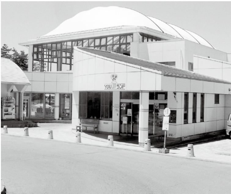
YOU游ランドの指定管理者制度移行はいつになるのか。

ンから24年経過し、施設の老朽化に伴う機械設備の更新が必要になったことから、現在大規模改修工事を平成31年頃まで見込んでおりますが、施工にあたり、長期の休業期間が必要となり、指定管理を行った場合、この休業保証問題が懸念されます。また、「地域公共交通網形成計画」におい