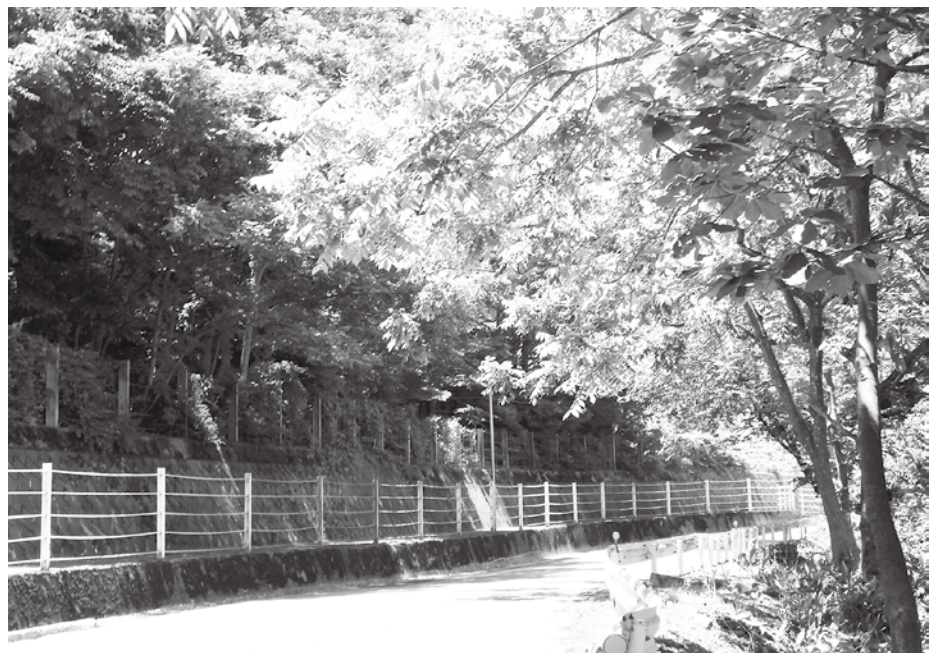
支障木撤去により、安全・安心に登下校できるように。

⑤8月の防犯運動、12月の特別警戒と年2回防犯会議の開催、地域でのパトロールの実施、セーフティ須高、パトロール高山の回覧や情報無線により、村民への注意喚起を促し啓発します。