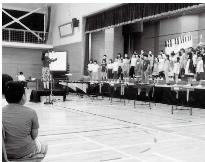
小学校で使用の副読本は平成31年度の使用開始に向け進める。