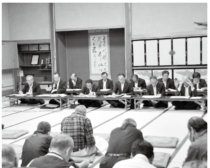
5月に開かれたブロック行政懇談会。

指定管理者導入に当たっては、職員の研修を実施しながら住民サービスの向上に努めるとともに、引き続き、住民のご意見も十分にお聞きする中で、慎重に検討して参りたいと考えています。