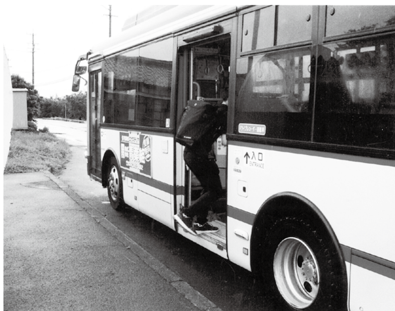
高校生の通学費助成も提案しました。

500円の自給者負担を行っている県は長野県を含む6県であります。残りの41県は窓口負担なしです。村が単独に行っている18歳以下を含めると、財政負担が大きく、窓口完全無料化につきましては、子育て支援施策を総合的に勘案する中で検討します。