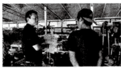
「GAP」東京五輪での食材要件に

全性を認証するものがないと世界では通用せず、オリンピックで提供する約1500万食には足りません。このままでは、ほとんどが輸入食材で調理されます。食材が足りないことはチャンスでもあり、GAP取得者が大幅に増える