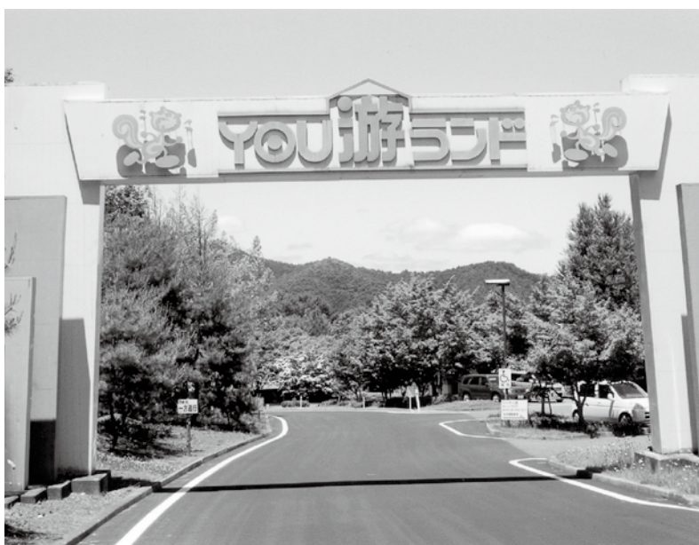
大雪のあと急激にいたんだYOU游ランド入口の道路。きれいに舗装されました。