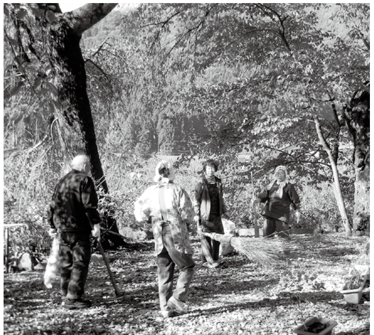
駒場西光寺の庭を清掃するボランティア活動の皆さん。

②重点的な環境指標にはホタルの里づくりの事業団体数や文化財保全の取り組み件数の拡大、資源の再資源化率の向上など協働して施策の指標を掲げております。優良な活動を表彰して、その活動を広く公表して参ります。