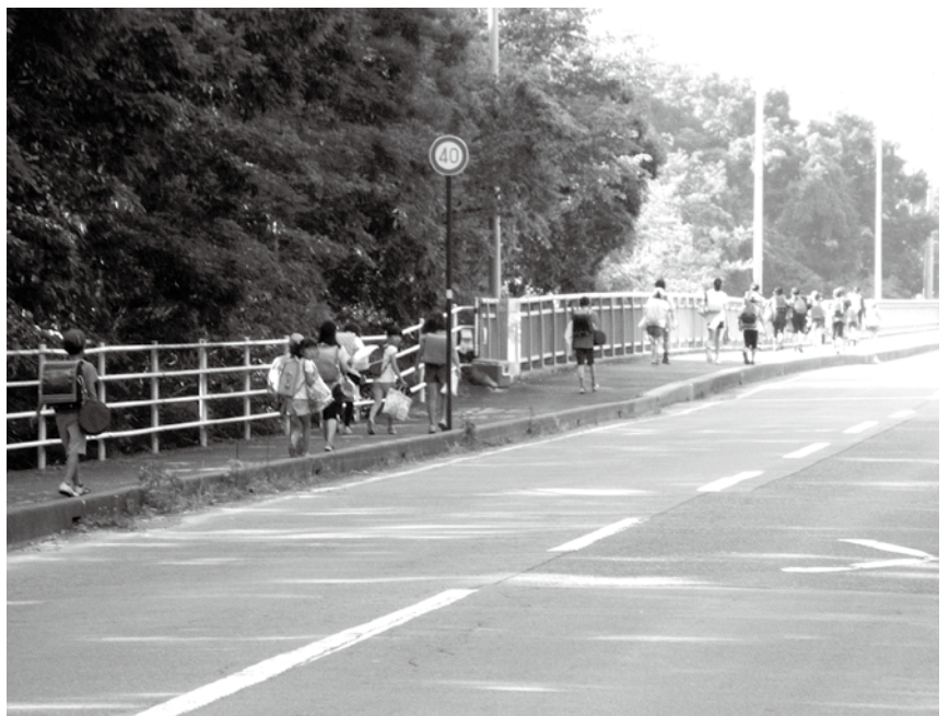
集団登校で並んで登校中の小学生たち。この子どもたちに勅語はいらない。

徳教育の基本理念とされてきました。しかし戦後、「日本国憲法」や「教育基本法」の制定に伴い、昭和23年に衆議院では「排除の決議」、参議院では「失効確認の決議」がされました。戦後は勅語に変わり、我が国の教育の基本理念としての「教育基本