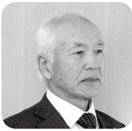
涌井 仙一郎 議員