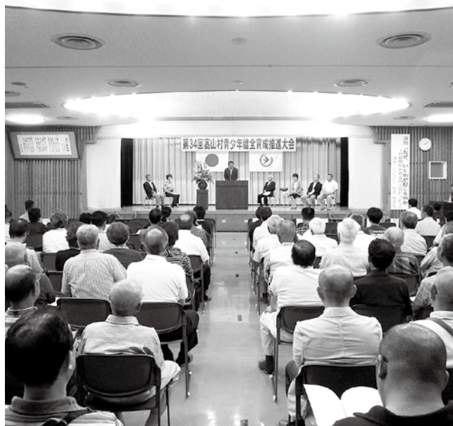
公民館講堂の大会風景。

設備関係は、機能的にしなければならぬので、村民や有識者からなるワークシヨップを基本設計の段階で設置します。