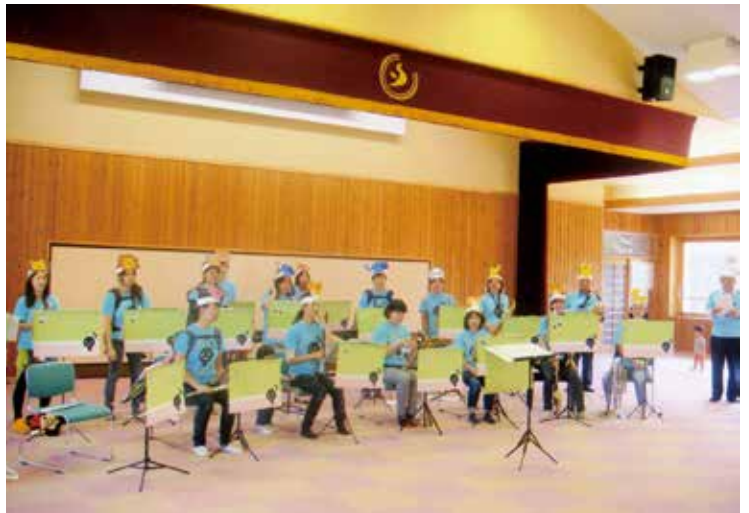
地域の活動にも参加しています。

らくはびっくりする事・戸惑う事ばかりで不安な毎日を過ごしていました。特に困ったのは言葉です。長野県の方言は地元佐賀より標準語に近いと個人的に思いますが、来た当初は呪文のようにしか聞こえず苦労しました。特に「ずく」の意味を覚えるのが大変でした。しかし、段々と子どもや趣味を通じて友達ができるようになり、今では地元佐賀にいた時以上に友人・知人ができました。色んな方々