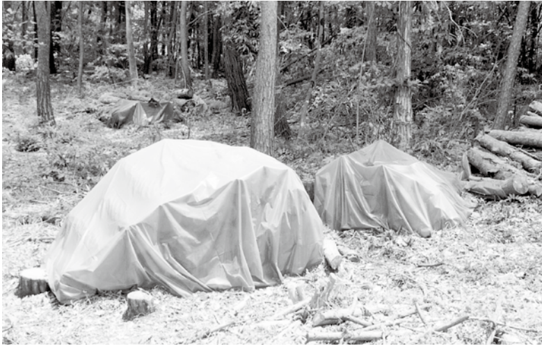
くん蒸処理中の松の木。ビニールをかけたのは今年の春駆除したものでくん蒸中です。(松川右岸の林)

ている。今年度は補助金等を勘案し、415㎡の駆除を見込んでいます。毎年国や県の補助金を活用して「くん蒸処理」や「破砕処理」の伐倒駆除を実施し、山全体が被害木に覆われることのないよう