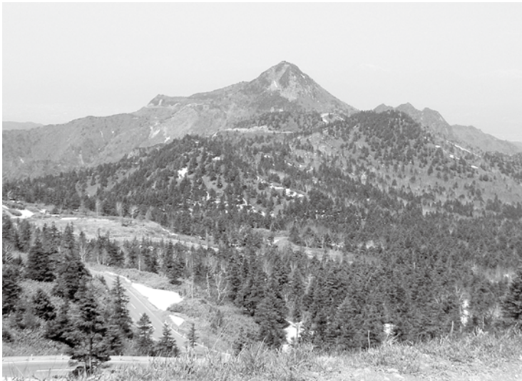
「志賀高原ユネスコエコパーク」の横手山頂から笠岳を望む。