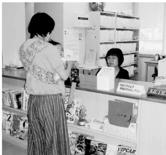
子どもの医療費窓口完全無料化へ。

答弁(内山村長) 5月3日の憲法記念日に憲法改正を求める集会に「2020年を新しい憲法が施行される年にしたい」と表明されました。憲法を尊重し、擁護することは当然のことと考えております。憲法改正に つきましては、国民的議論が必要と考えております。安倍首相の発言に 対しどのように思うかは、 答弁を差し控えたい。