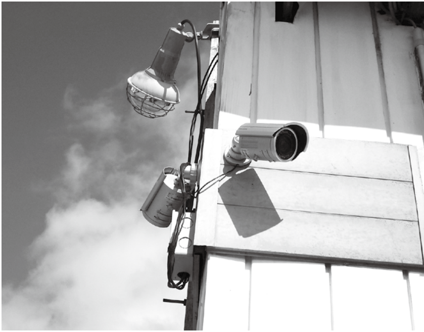
24時間撮影が可能な防犯カメラは犯罪の抑止効果、容疑者の特定に役立つ。

質問 防犯とは、犯罪を未然に防止することで、受動的防犯に分けられます。と能動的防犯に分けられます。 犯人逮捕や犯罪抑止には、威力を発揮しているのが、防犯カメラです。最近、村内で頻繁に農機具等の盗難が発生し、異常な事態となっております。