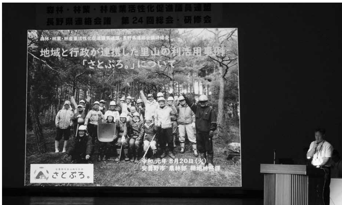
安曇野市里山再生企画「さとぶろ。」は地域と行政が連携した事例です。