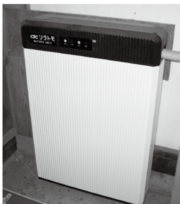
非常時の停電にも対応できる、太陽光発電と蓄電池を組み合わせたシステムは、これから家庭用も普及していくと思われる。しかし蓄電池が大変高額で普及の足かせになっており、補助制度の新設が望まれます。写真は村内の家屋に設置された太陽光発電+蓄電システム。

答弁 村には家庭用太陽光発電に最大35万円の補助制度がありますが、蓄電システムへの補助は現在ありません。国の「災害時に活用可能な家庭用蓄電システム導入促進事業費補助金」という、最大60万円の制度を活用いただきたい。蓄電は災害時に重要な役割をするので、村の補助制度は今後検討します。