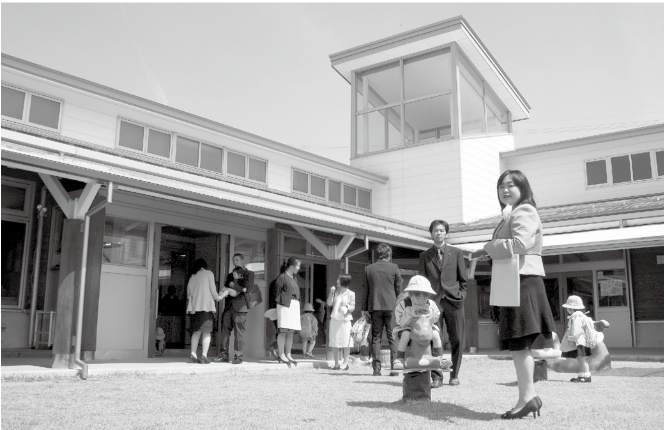
10月1日から3～5歳児の保育料の無償化が始まりました。

増です。29年度に562・5%の大幅増をみた寄付金は、「ふるさと納税寄付金」やその「企業版」などで30年度