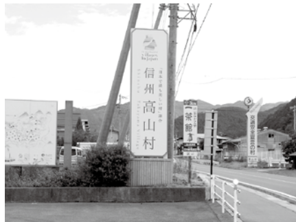
須坂市から高山村への入り口付近