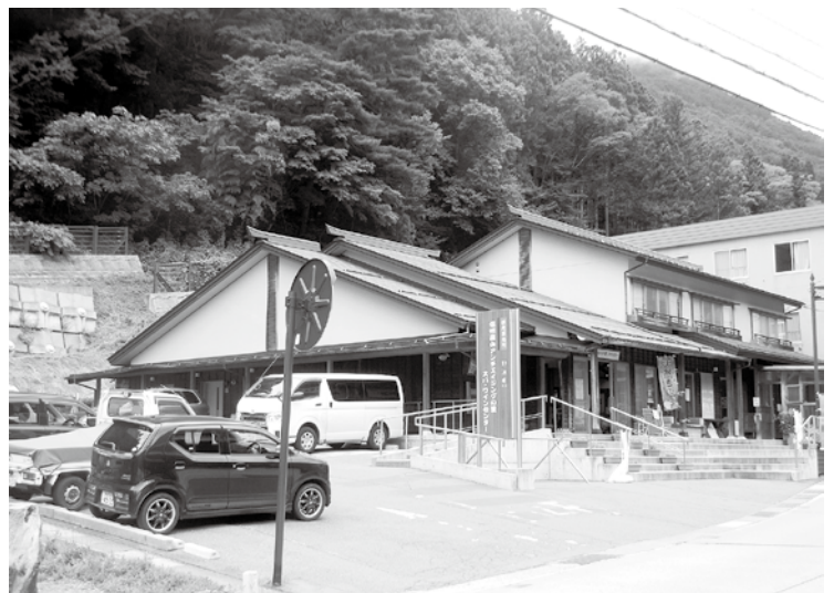
外国人観光客の誘致拡大が望まれる信州山田温泉。

昨年10月からスタートした公共交通利便性向上事業によりICカード「くるる」の活用による連携。銀座NAGANOでの「ぐり」とながのマルシェや北陸新幹線延伸に伴い、金沢市において「おいで