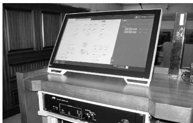
コントロールはタッチパネルで行います。