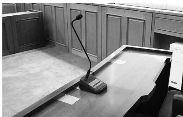
各席のマイクはスリムなブラック仕上げになりました。