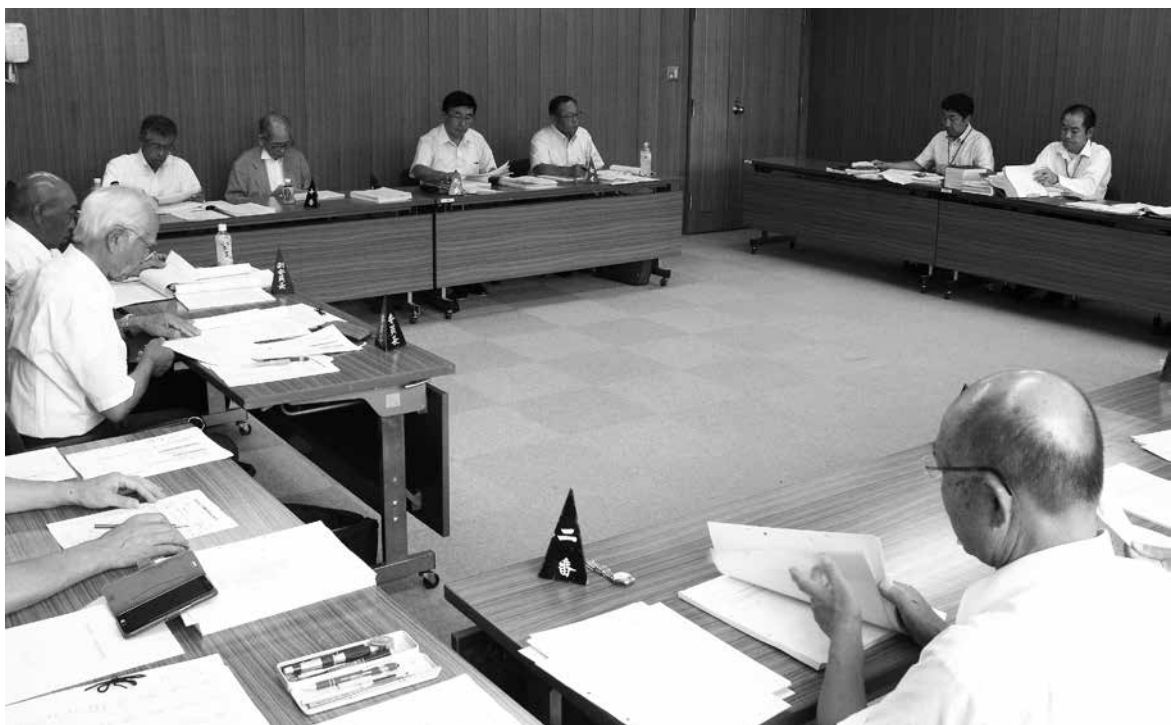
平成30年度の歳入歳出決算資料と事業の成果を3日間かけて審査します。