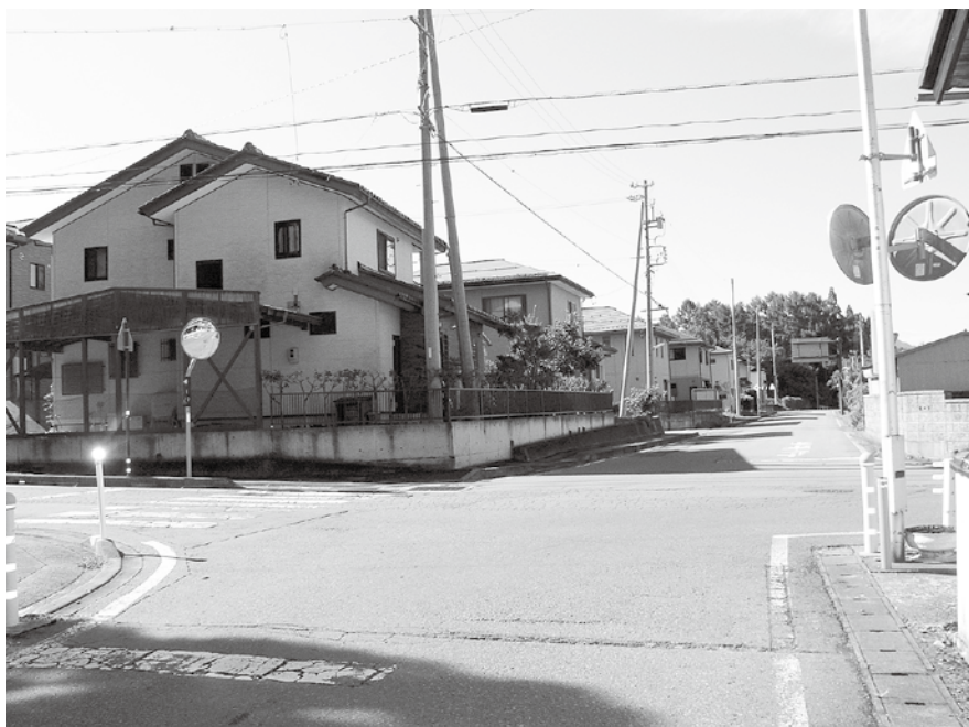
高井地区にも団地造成や村営住宅の建設を。(写真は中原区)

質問 住民の方より「高井地区に団地造成や村営住宅の建設を」との意見があります。 理由として、村商工会が委託運営している婚活事業では、昨年は9組のペアと3組の婚約が成立し、年内にめでたく結婚