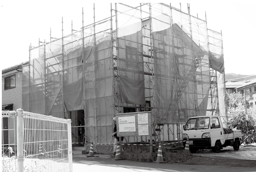
建築工事中の高山村中原住宅。

また、「今後どのように事業展開するのか」については、新たに住宅地造成を計画する場合、区画数にもよりますが、ある程度まとまった用地の確保が必要となります。また、現在の不動産取引価