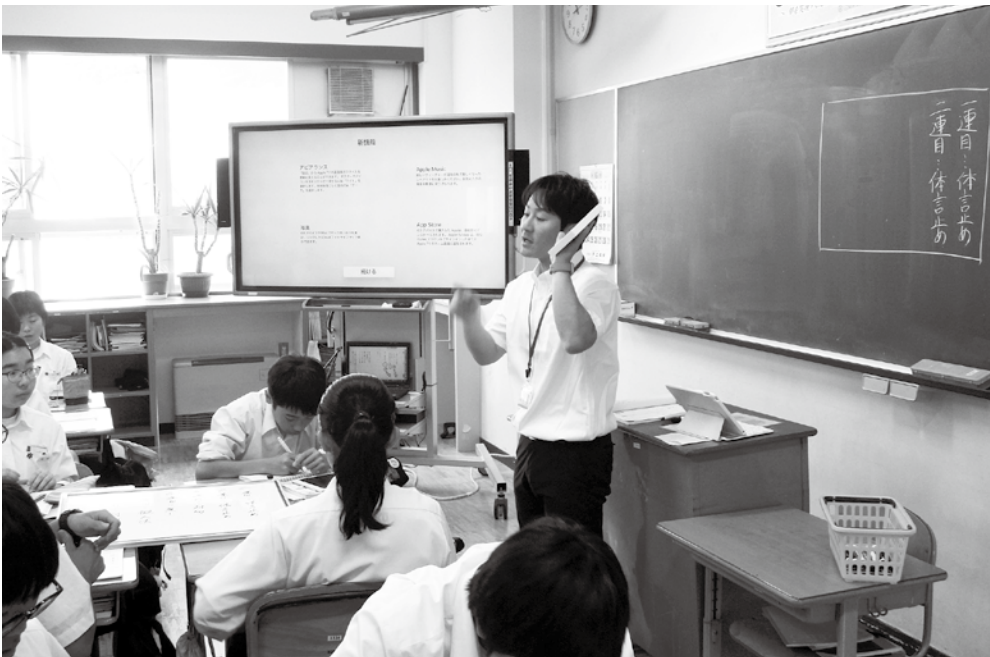
資料や映像を大画面ディスプレイに提示し、興味関心を高めたり、理解を深めます。