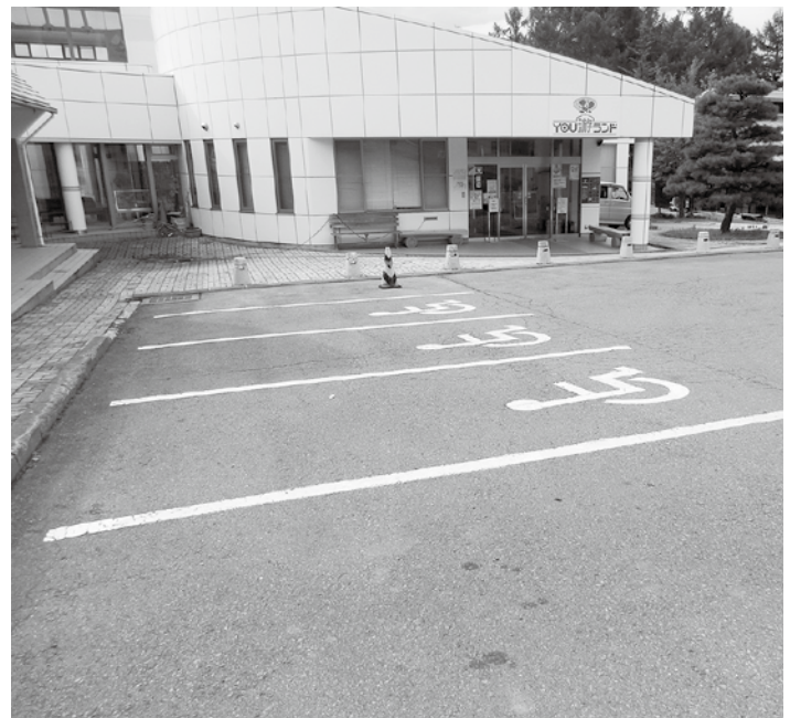
ふれあいバス待合室建設予定のYOU游ランドです。

質問 ①8月15日は木曜日で通常なら休館日でしたが、16日に変更する旨の放送がありました。ところが、変更になった16日もお盆期間に当たっています。なぜ8月16日を休館日にしたのか、お聞きします。 ②YOU游ランドのバス待合室建設の件です。できるだけ早い待合室やバス駐車場の完成を待つておられる方がいますので、バス待合室建設の進捗状況を伺います。