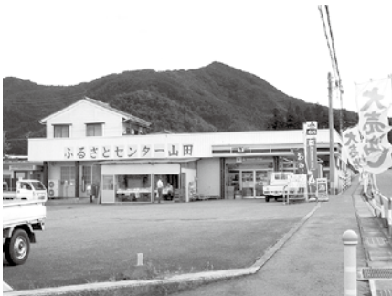
ふるさとセンター山田周辺