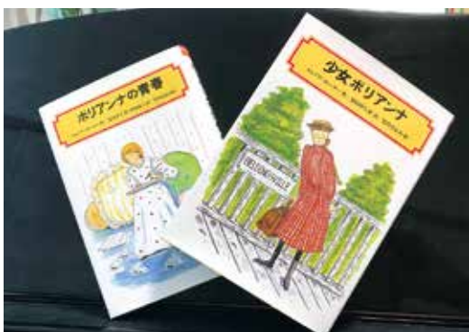
『嬉しくなるゲーム』は「少女ポリアンナ」に出できます。みんなで『嬉しくなるゲーム』をして、『自分を好きになる』そんな仲間作りをしたいです。

時代なのに、自分を好きになれない故に親が子を殺めたり、あおり運転や詐欺の受け子等々、考えられない事が増え続けています。共通している事は、「自分を好きになる」その練習をさせて貰えていない事かと考えると、悔しく悲しいです。人、社会、境遇、年齢等のせいにするのでは無く、唯一自分と向かい合う事の練習が、『自分を好きになる』為の練習だと思えます。明るい未来の為に、みんなで『嬉しくなるゲーム』を練習して、『自分を好きになる』そんな仲間作りをしていきたいと思うこの頃です。