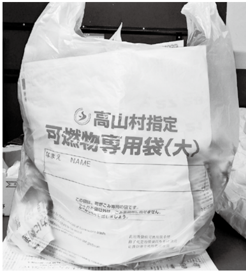
介護度3以上にゴミ袋支給をしてください。

答弁 (宮川村民生活課長) 要介護3以上の方は154人です。在宅で介護されている方には「寝たきり高齢者等家庭介護手当」が支給されていますので、ゴミ袋実費分は負担していただきたいと考えています。