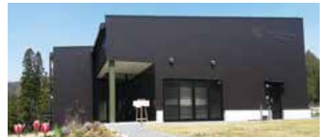
黒部地区にある信州たかやまワイナリー。