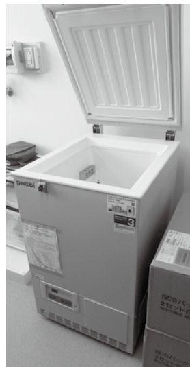
コロナウイルスワクチン用冷凍庫。