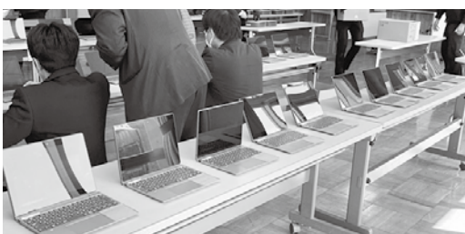
全児童・生徒が使うタブレットの準備中。