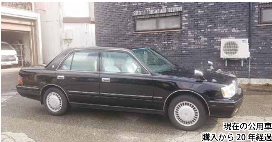
現在の公用車 購入から20年経過