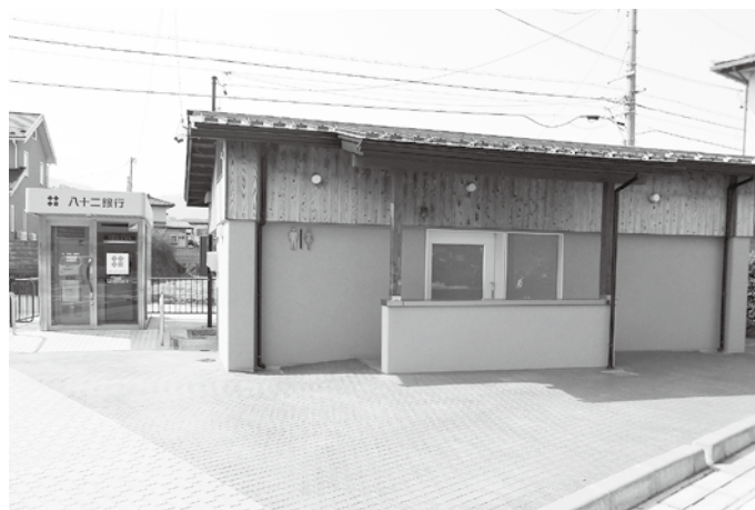
トイレ廻りの地盤沈下。

ですが、一般的な公共工事における瑕疵担保期間は2年間で、今回の工事は完了から2年が経過しておりますが、施工期間を過ぎておりますが、施工業者に相談したところ業者の負担で誠意をもって必要な対策を講じていただくことになり新たな村の負担はございません。