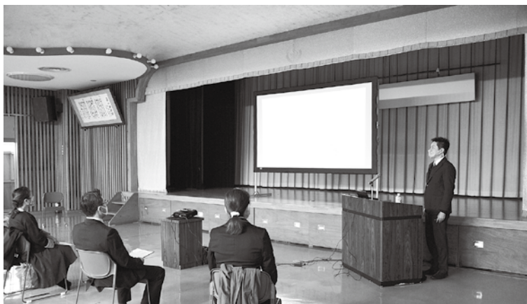
いきいきフォーラム。密を避けるため人数を絞って開催。

また、策定を義務付けられる301人以上の従業員を有する企業は3社であり、各事業所ともに、それぞれ目標値を設定し努力推進されておられるとお聞きしております。