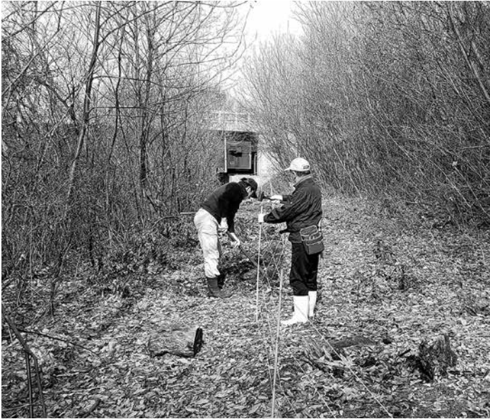
松川沿い中山側簡易電柵管理作業（年6回）。