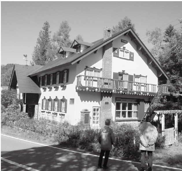
にぎわいの場整備予定地に隣接する民間事業者が取得した仙人小屋。