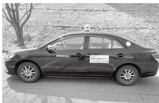
当日の予約で午後の利用が可能な高井中山乗合タクシー。

「高山村地域公共交通網形 成計画」を策定するにあつ ては、社会情勢や住民のニ ーズの変化を踏まえ、適宜見直 しを図りながら進めることに しています。長電バスの運 行ダイヤについては、現計画 の目標年次となる令和5年