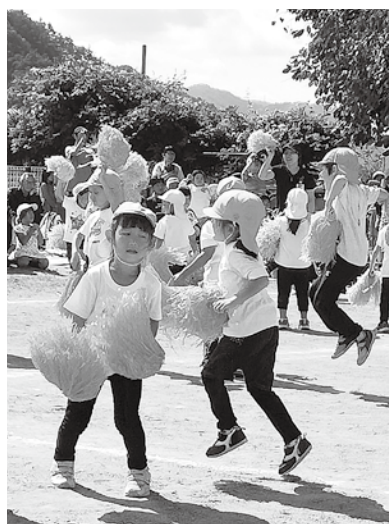
国保の子供均等割りを廃止してください。