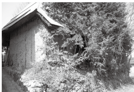
木が繁茂し石垣が崩れ、とても住めない廃屋。特別措置法の対象？

生活困窮者に対する支援も検討して参りたいと考えているが、新型コロナウイルス感染の影響により失業した方の把握方法に加え、生活困窮者の具体的な定義がないことなどから、国の動向・他市町村の事例などを参考にするなど、慎重に対応していく。