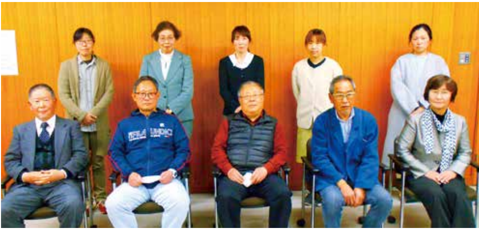
公募により決定した10名の議会モニターの皆さん。

3月定例会開会中の3月12日に委員会を開催し、今後の対応について、議員間での大筋の合意がなされました。