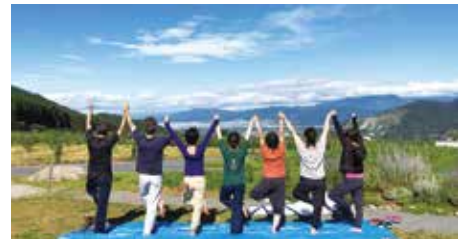
月一開催される「ワイナリーヨガ」