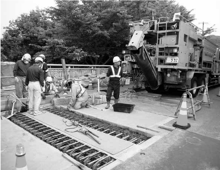
ゆうゆう橋の補修工事。