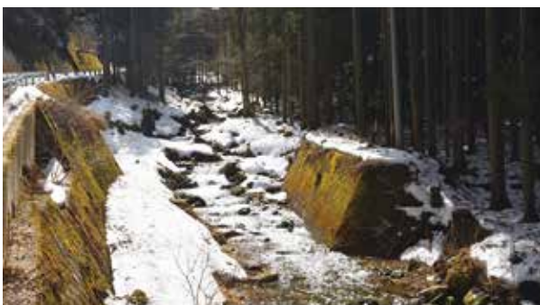
河畔林整備された杵沢川。

建設水道課長 一級河川の「松川、八木沢川、樋沢川」は須坂建設事務所が管理し、河畔林整備計画がないため面積は把握していない。村管理の「杵沢川、樽沢川、久保川、不動川、淵ノ沢川、鎌田川」などは村が管理している。杵沢川は令和2年事業により整備が終了となり、その他河川も村単独事業や国の災害復旧事業で護岸や河床の整備と流失危険木の除去が行われ、上流部の危険箇所も順次整備しています。村では毎年、県が管理する道路や河川、砂防事業などについて須坂建設事務所と「事業調