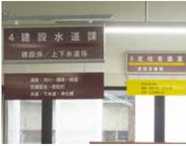
本年度より定住支援室が新設になります。

村では若者世帯の増加策として、「若者定住促進住宅」や「新規就農者住宅」などの村営住宅を整備してきた。空き家活用推進事業では、家財処分費用、空き地や空き家の購入費用、また増改築費用などの助成を大幅に引上げるほか、親と同居の新築、増改築に50万円の助成で、若者世帯の定住促進に努めて参りたい。