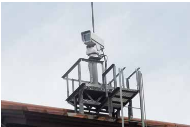
役場屋上のライブカメラ。

役場から見える善光寺平の夜景や北アルプスの眺望の素晴らしいですが、季節ごとの村の風景を閲覧して頂くという現在の運用を基本に慎重に検討してまいりたい。