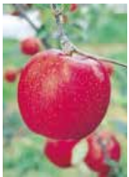
毎年、多くのファンに人気の高山村のリンゴ。

産業振興課長 今後、J Aながの等の皆さんと相談の上、必要な対策を検討していく。