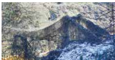
アレチウリがはびこる旧藤沢吊橋。

藤沢吊橋は奥山田地区と牧地区を結ぶ重要な橋として利用されてきた。この形式は木橋であり、道路橋示方書で示す基準を満たさない事で昭和46年に架け替えられた。現在は吊つてある金具が腐食し、落橋の恐れがある