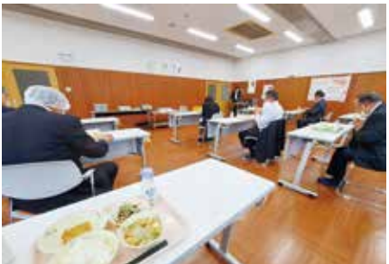
美味しい給食をいただきました。