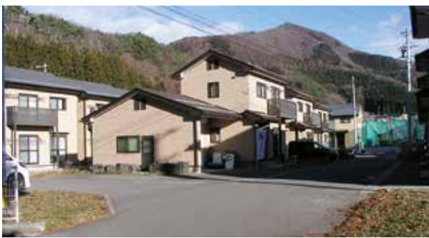
人口対策には、早期に村営住宅団地を!!

村では人口減少・少子高齢化に対応するため、人口減少の進行を可能な限り抑制し、持続可能な活力ある村づくりに向けて、令和6年度までの推進計画として、第2期目の「高山村総合戦略」を策定し、