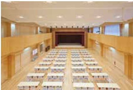
多目的に使えるフラットなホール。小さいながらもステージ設備も完備。

豊丘村では、平成26年に竣工した交流学習センター『ゆめあるて』と、併設の大型『図書館』を視察しました。『ゆめあるて』は多目的に使えるように、人の移動が容易な平屋建ての設計で、文化、芸術、教育の中心となる施設です。会議室もホールも広々としていて、多目的な利用が可能です。また、『図書館』棟は蔵書数55,839点で、閲覧席が74(県内で17番目に多い)もあり、来館者は明るく広い館内で大量の本の海に囲まれて至