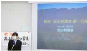
宮田村の天野議長から説明をお聞きました。

知っていたただく）、本村のモニター会議と似ている。②オンライン会議・ペーパーレス会議（タブレットを導入し完全な「ペーパー