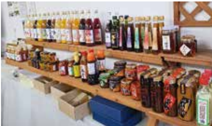
小池手作り農産加工所で作られている商品の一部。