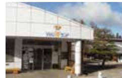
指定管理者制度導入について質問したYOU遊ランド。

いの場構想」の候補地のひとつとして考えているので指定管理者導入については慎重に判断していきたいと考えていきたい。