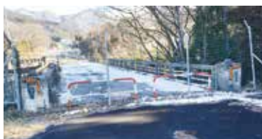
通行止めの旧樋沢橋。

ことから松川の管理者である須坂建設事務所と協議し、撤去に向けて検討する。 一方、旧樋沢橋については、交通量の増加に伴い、道路線形が急カーブな為、視界が悪く危険であることから、昭和63年より須坂建設事務所が新樋沢橋工事に着手し、平成6年3月に工事が完成した。不要となる旧橋は村に譲渡され管理していたが、経年劣化と落橋による河川断面の阻害が心配されるため、今後、県道促進期成同盟会や河川管理者の意見を聞きながら検討する。又樹木伐採については、須坂建設事務所により子供たちや歩行者の安全確保の観点から、年度内に伐採する旨の回答があつた。