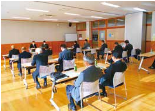
広く明るい会議室。

豊丘村では、平成26年に竣工した交流学習センター『ゆめあるて』と、併設の大型『図書館』を視察しました。『ゆめあるて』は多目的に使えるように、人の移動が容易な平屋建ての設計で、文化、芸術、教育の中心となる施設です。会議室もホールも広々としていて、多目的な利用が可能です。また、『図書館』棟は蔵書数55,839点で、閲覧席が74(県内で17番目に多い)もあり、来館者は明るく広い館内で大量の本の海に囲まれて至