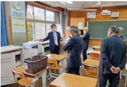
整備状況の説明をお聞きました。