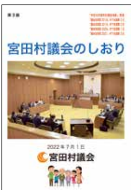
議会についてまとめられている宮田村の「議会のしおり」