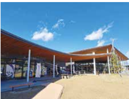
とよおかマルシェ外観。

豊丘村は面積76,799km 2 中央アルプスと南アルプスからなる伊那谷の南部、天竜川が形成した日本一とつたわれる河岸段丘の中心に位置し、人口6,655人、2,295世帯と高山村と同じ位の人口の村です。特産品として松茸、りんご、市田柿が有名です。当初は村道に面しているのが「農産物直売所」「農家レストラン」での「村の駅とよおか」構想でいたのですが、国の要請もあり「道の駅南信州とよおかマルシェ」として2018年オープンしました。一番の特徴は地元住民の生活のかなめである地元