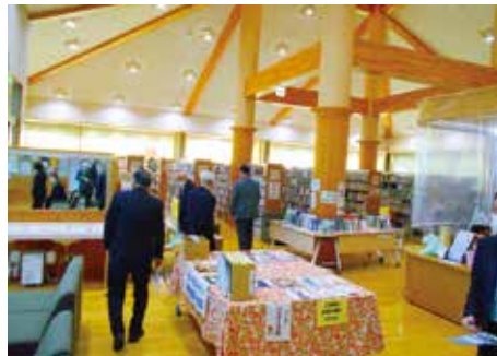
コーナーも工夫された図書館。

福の時間を過ごすことができます。また、誕生日を迎えた子供一人ひとりに村から本を贈る事業もされているそうです。