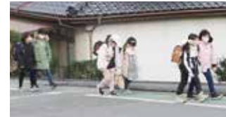
小学生の登校風景。