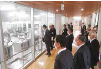
高山村学校給食センターが文部科学大臣表彰を受賞しました。