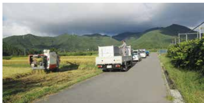
有効農地を次世代に

作者を記入した目標地図を作成するための基礎資料と位置づけており、すでに耕作放棄地となっている農地を解消するための資料とは一線を画しております。 今後とも耕作放棄地の解消に向けて、農業委員会を始め、関係機関と連携をみにつし、守るべき農地を次の世代に引き継いで参りたいと考えております。