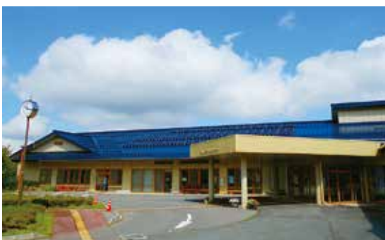
健康福祉総合センター再生可能エネルギー