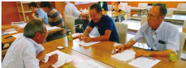
皆さんのお話から、沖島議員は9月議会の一般質問をされました