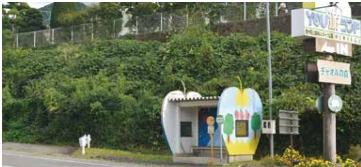
樋沢橋周辺の状況

フェンス未設置の箇所は民有地ですが、県によると「道路施設として転落防止柵等の必要性については、関係者の意見を聞いたうえで判断した