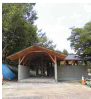
山田牧場の休憩施設