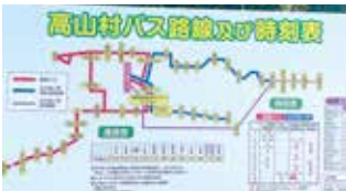
YOU 游ランドにある表示板

新型コロナウイルス感染症緊急事態 宣言の発出や幹線をYOU遊 ランドまでに改めたこと、ま た往復41便から29便に減便し たこと等が 利用者減少 の要因。 公共交通 再編計画で は利用状況 や計画達成 状況を検証 し事業費の