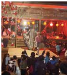
子ども達が大喜びで集まるお菓子撒き