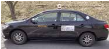
デマンドタクシーの利用拡大を

問 朝日村に視察に行った。村 は「松本地区 交通協議会」 に参加して いる。お買い 物バス運行 など須坂市 を含め広域 の交通協議 会設置が必 要と思つが。