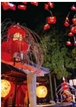
わくわくする提灯の明かり