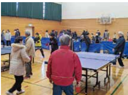
試合前の練習風景