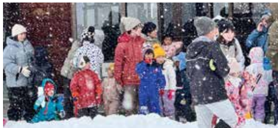
吹雪の中、心配そうな表情を見せる子ども達

当日は、あいにくの天候でしたが、幼児から小学生まで、35名が参加しました。集まった子ども達は、吹雪に負けずに元気にみかん拾いとパン食い競争に参加していました。「こんな吹雪の中、大勢の参加者でびっくりしました。」「深い雪の中、小さな姉弟が手をつないでパン食い競争に参加している姿にとても感動した」との感想が聞けました。