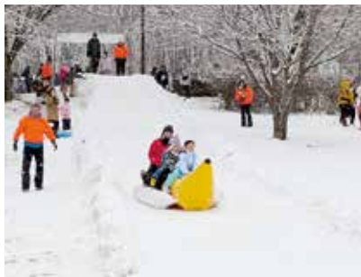
整備されたコースをバナナボートに乗って滑り下る参加者

YOU遊ランド芝生広場において、ソリ滑走距離大会が開催されました。前日までのところで雪不足が心配でしたが、総合型スポーツクラブ員の力で、見事なコースに仕上がりました。当日は、粉雪舞い散る肌寒い中でしたが、たくさんの方々が村内外からソリ持参で集まりました。