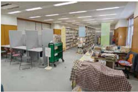
図書室には図書の閲覧のほかに学習コーナーもあります