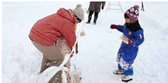
子どものひざまで真っ白!!

当日は、あいにくの天候でしたが、幼児から小学生まで、35名が参加しました。集まった子ども達は、吹雪に負けずに元気にみかん拾いとパン食い競争に参加していました。「こんな吹雪の中、大勢の参加者でびっくりしました。」「深い雪の中、小さな姉弟が手をつないでパン食い競争に参加している姿にとても感動した」との感想が聞けました。