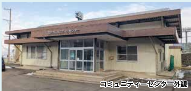
コミュニティセンター外観