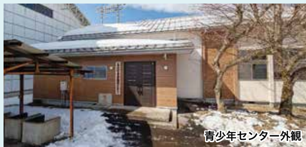
青少年センター外観