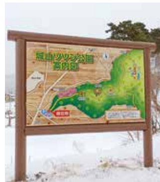
リニューアルした案内看板 (荒井原)

平成7年度に城山の山頂につながる山道と展望台が整備され、荒井原と赤和の入口2か所に案内看板を設置しました。