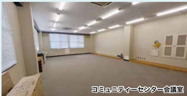
コミュニティセンター会議室