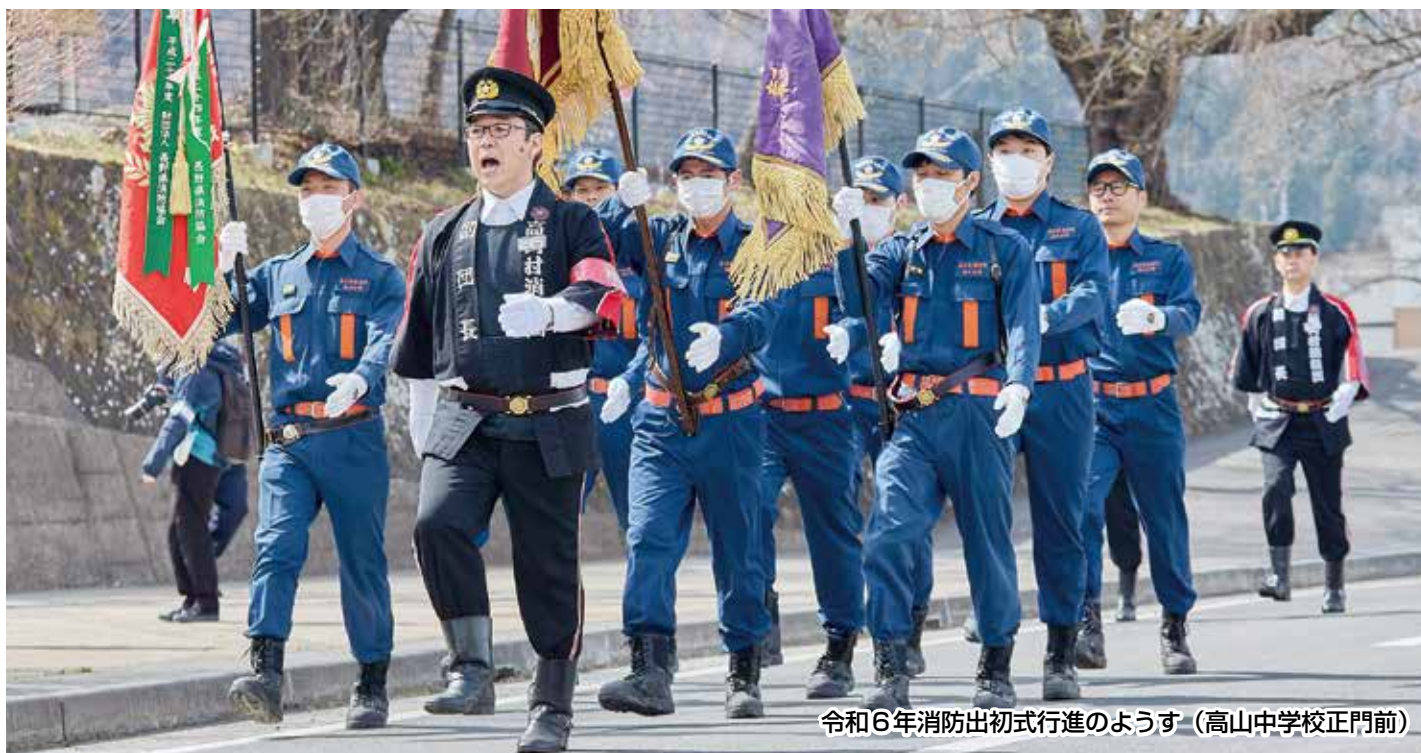
令和6年消防出初式行進のようす（高山中学校正門前）