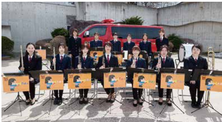
吹奏楽団「プティ・あんさんぶる」

吹奏楽団「プティ・あんさんぶる」は、村民の皆さまと消防団をつなぐ架け橋となり、それをきっかけに多くの方に消防団の活躍を知ってもらえるよう、そして防火・防災への意識づけに繋がるよう、今後も活動してまいりますので、応援よろしくをお願いします。