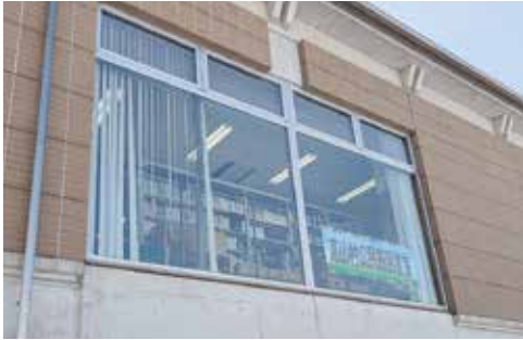
窓には図書室の看板が見えます