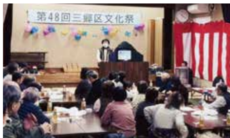
紙芝居は「待ちぼうけ」

三郷分館では毎年2月の初旬に文化祭を開催しています。本年度は去る2月9日の日曜日に開催いたしました。会場は三郷集落センターで、隣接するふれあいセンターでは皆様の作品やコレクションなどの展示を行いました。 文化祭準備はだいたい前日までに終わっているのですが、当日の用意は例年ほとんどありませんが、今年は前々日より大雪で受付時間の2時間前に分館役員は集合し、会場の雪かきに追われました。 例年、区民の方は受付開始時刻より少し早く来場して、