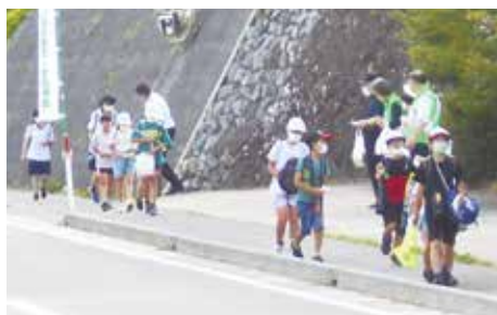
マスク越しに笑顔であいさつ