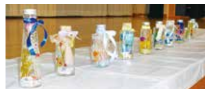
世界に一つだけのハーバリウム

「完成したのを見ると予想していたのと違った」「この次はもっとうまく作りたい」という声がありました。