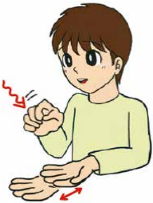
(イラスト提供：長野県)