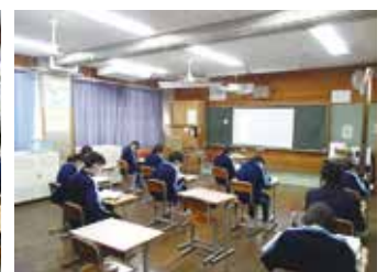
リモート授業をする教室