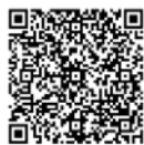
村ホームページの 開花状況ページへ