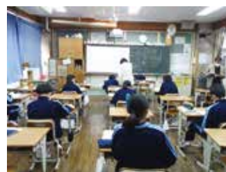
教師が対面で行っている教室

今後、学校生活がどのようになっていくか見通せない所ですが、何とか皆さんに助けていただきながらよりよい高山中学校になるようがんばりたいと思います。どうか、よろしくをお願いします。