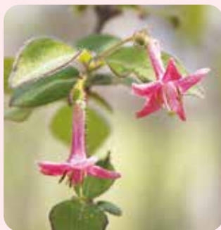
ミヤマウグイスカグラ