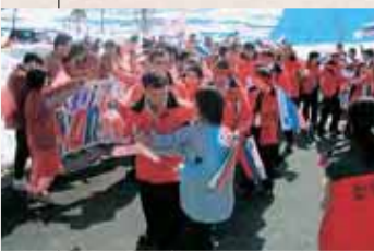
【平成17年】スペシャルオリンピックス スロベニア選手団来村