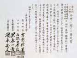
合併に関する協定書