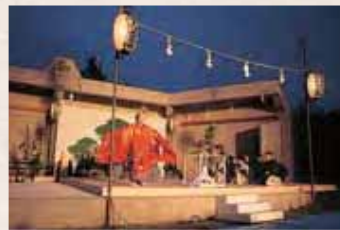
【平成8年】信州高山「新能」開催