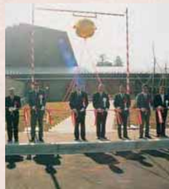
【平成8年】一茶ゆかりの里一茶館竣工