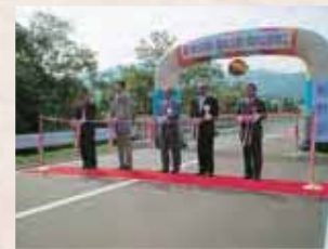
【平成16年】牧5号線「ゆうゆう橋」竣工