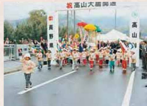
【昭和63年】高山大橋開通