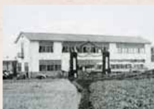
【昭和32年】完成した役場庁舎