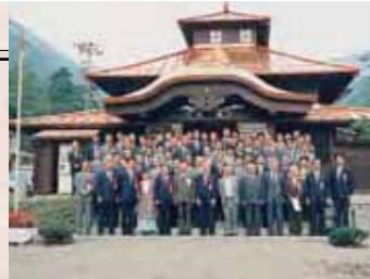
【平成元年】山田温泉改築工事竣工