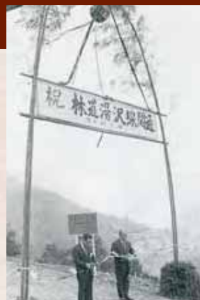
【昭和49年】林道湯沢線開通