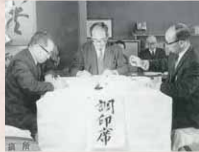
【昭和43年】高井・山田両農協合併調印式

無秩序な開発を抑制し、住民の快適な暮らしを支える環境整備に大きな力が注がれていきました。