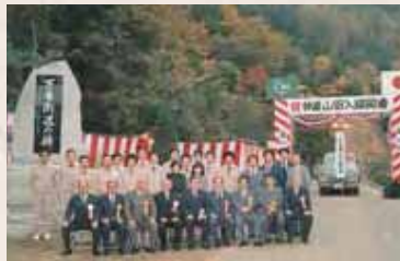
【昭和58年】林道山田入線竣工