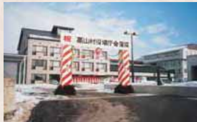
【昭和59年】新役場庁舎竣工