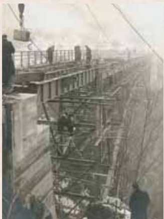
【昭和33年】高井橋建設工事