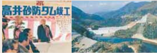
【昭和51年】高井砂防ダム竣工