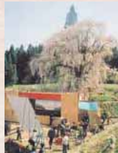
【平成16年】水中のしだれ桜で映画「北の零年」撮影