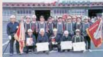
【平成2年】第五分団県大会優勝