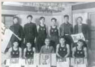
【昭和33年】第4回郡下縦断町村対抗駅伝で高山村優勝