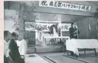
【昭和43年】南志賀(七味笠岳線)バノナマールト開通記念祝賀会