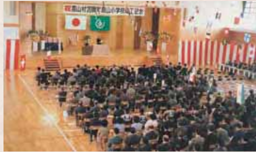
【昭和53年】村制施行二十周年・高山小学校竣工記念式典