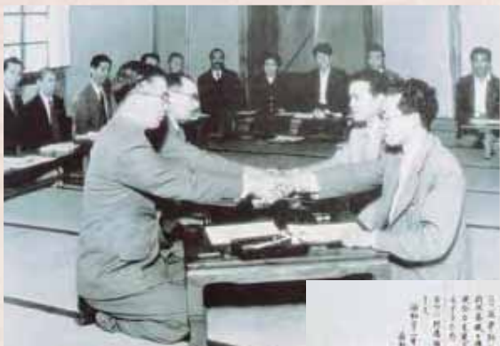
【昭和31年】合併調印式高井村と山田村が合併し高山村が誕生した

また南志賀温泉郷観光協会が設立され、温泉と高原、スキーを活用した観光振興が推し進められていきました。