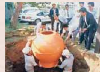
【昭和61年】タイムカプセル埋設作業