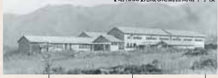
【昭和35】完成した統合高山中学校