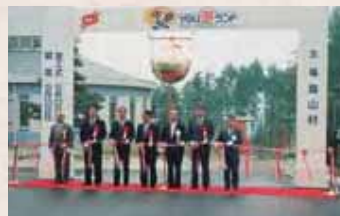
【平成5年】YOU遊ランド竣工