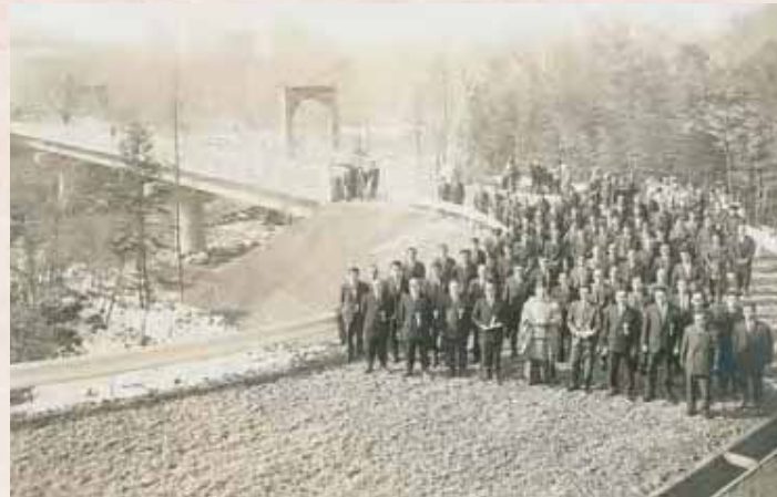
【昭和42年】沖渡橋永久橋架設工事竣工