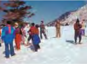
かんじきトレッキング 雪上を歩くための知恵、かんじき。大パノラマの見える眺望の美しい場所へご案内します。

冬のイベント情報 山田牧場スキー場オープン .....12月中旬 山田温泉スキー場オープン .....12月下旬 かんじきトレッキング .....1月~3月 信州高山温泉郷スキー大会 .....3月上旬