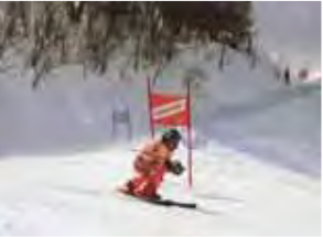
信州高山温泉郷スキー大会 未来のアスリートを目指す小学生から一般まで、12の部門で競われるスキー大会。