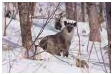
白銀のペールが舞い降りる感動のウインタースポーツリゾート。