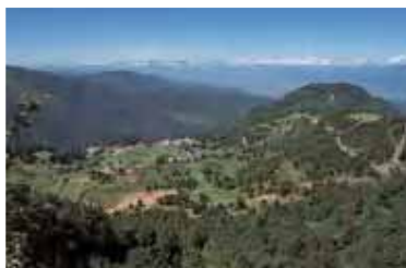
山田牧場 明治33年創立という由緒ある公共牧場。159haの放牧地に100頭以上の牛や馬が放牧されています。

そんな高原の夏は、キャンピングやハイキング、笠岳トックینگなどを楽しむ人々で賑わいます。