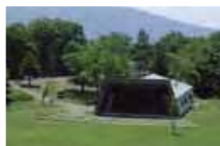
カリヨンホール 爽やかな高原の野外ステージ。隣接して山田牧場キャンプ場が開設されます。